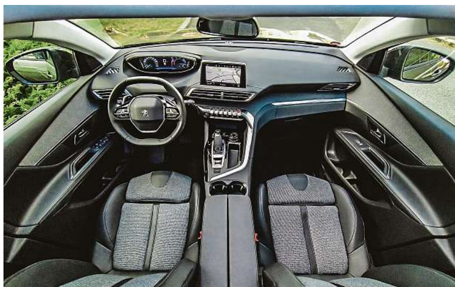
Malý zkosený volant a úzká kaplička s budíky. Kokpit působí extravagantně.

A uvnitř? No je to přece Francouz, buďte rádi! HOP