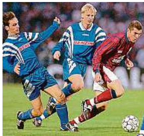
Slavia proti Bordeaux

Nejslavnější fotbalové zápasy historie nebo úspěchy českých reprezentantů. To je náplň sportovních médií.