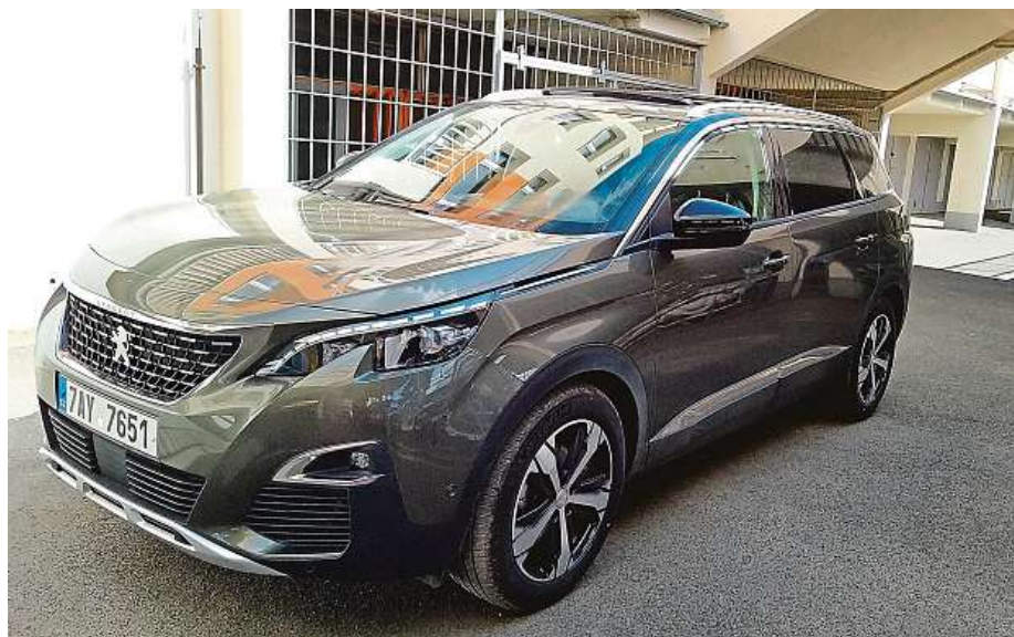
Uzkie šrafované LED pásky nad předními světlými a výrazná maska. Tohle SUV má prostě styl.