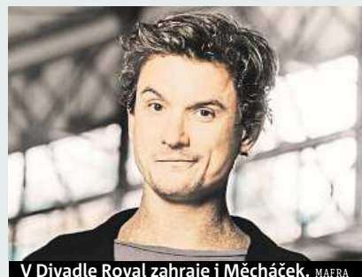
V Divadle Royal zahraje i Měcháček.

Osm skvělých komiků, kteří vás zaručeně rozesmějí. To nejlepší z úspěšné Stand-Up comedy show vás čeká od 20 hodin v Divadle Royal.