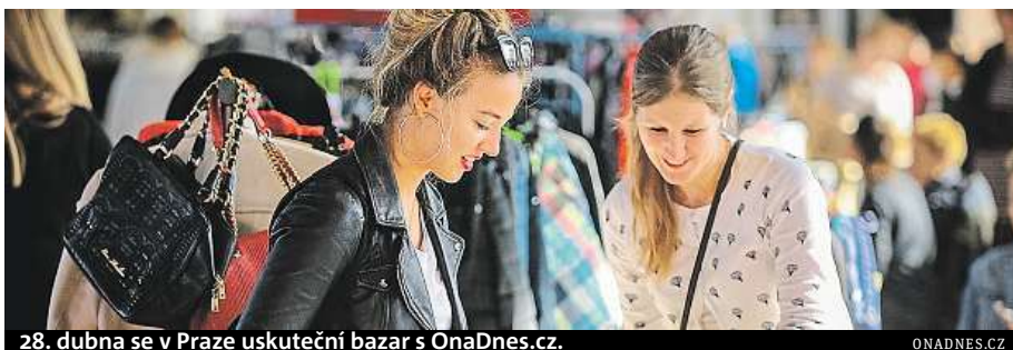
28. dubna se v Praze uskuteční bazar s OnaDnes.cz.

Jarmark již po dvacáté pořádá internetový magazín OnaDnes.cz spolu s Nadací Terezy Maxové dětem a Nadací Agrofert. V průmyslovém paláci v pražských Holešovicích bežmála pět stovek prodávajících nabídne přichozím to nejlepší ze svých skříní, a to