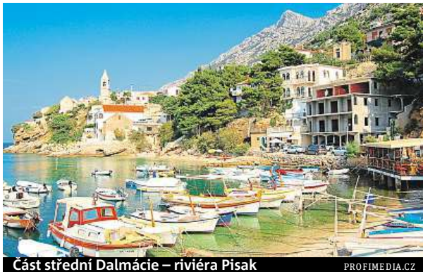
Část střední Dalmácie – riviéra Pisak