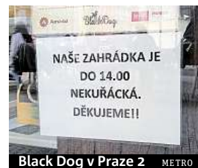
Black Dog v Praze 2 METRO

stolky a židle kam umístit. V Plzni přitom letos počítají s uzavíráním dohod na předzahrádky na podstatně delší dobu než jenom na letní období. „Vzhledem ke kuřáckému zákonu jsou dohody uzavírány na celý rok, tedy dvacet měsíců,“ říká náměstkyně Jůzová. Vyplývá to ze zkušeností mnohých majitelů plzeňských předzahrádek po skončení podzimní a zimní sezony, kdy nabízejí místa pro kuřáky i venku na ulici doplněná o tepelné zářiče.