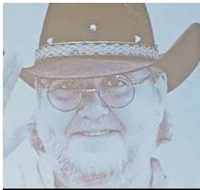
Country legenda