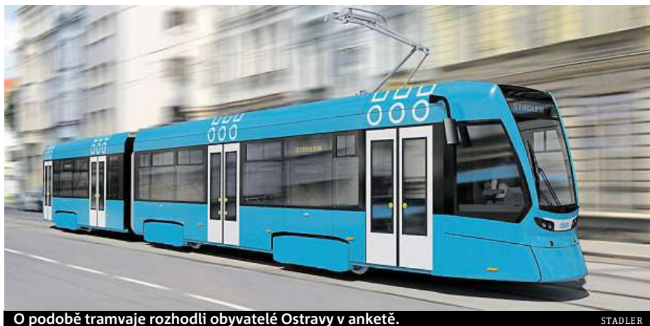
O podobě tramvaje rozhodli obyvatelé Ostravy v anketě.

Celou galerii nejmodernějších tramvají naleznete na našem webu Metro.cz . MET