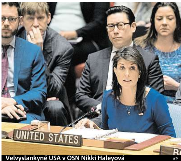
Velvyslankyně USA v OSN Nikki Haleyová

Americký prezident Donald Trump o probíhajícím útoku na Sýrii informoval v přímém přenosu. Vojenskou akci tří zemí označil za boj proti barbarství. „Nejsou