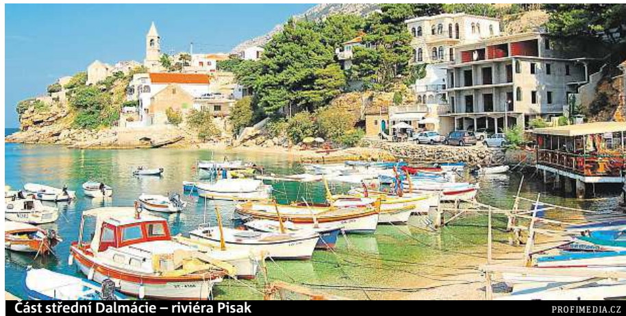
Část střední Dalmácie – riviéra Pisak

Co letos vyrazit do střední Dalmácie? Turisté mohou zamířit na jednu z místních riviér – na místní ostrovy Brač, Hvar či Vis. Právě na ostrovech jsou ty nejznámější pláže – na Brači třeba Zlatni rat.