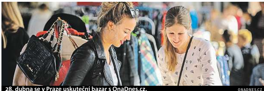
28. dubna se v Praze uskuteční bazar s OnaDnes.cz.

Jarmark již po dvacáté pořádá internetový magazín OnaDnes.cz spolu s Nadací Terezy Maxové dětem a Nadací Agrofert. V průmyslovém paláci v pražských Holešovicích bezmála pět stovek prodávajících nabídne příchozím to nejlepší ze svých skříní, a to