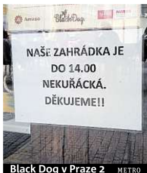
Black Dog v Praze 2 METRO