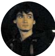
Jeníček Z Větrného Města Život v Praze komplikují pouze nápady Řopidu.