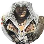
Pedro Auditore Da Firenze Vůbec ne, bude spíš komplikovaně vidět zajímavé zápasy.