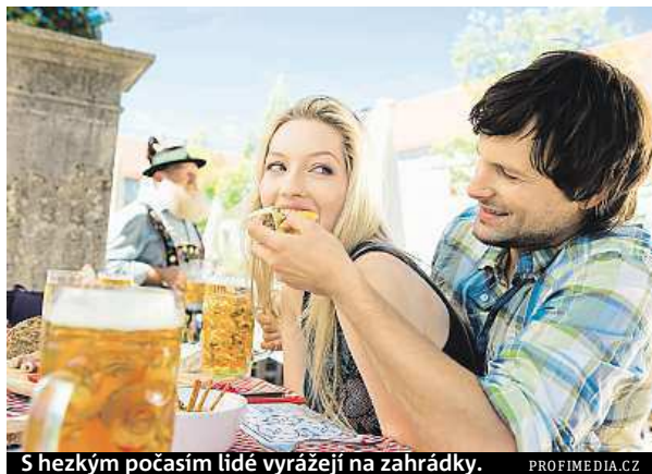
S hezkým počasím lidé vyrazí na zahrádky.

Právě této radnici plynou každoročně z restauračních zahrádek příjmy okolo sto milionů korun. Radnice v jiných městech naopak od poplatků upustily (více v boxu). „Důvodem pro zrušení před více než šesti lety byla podpora podnikání a cestovního ru-