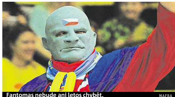
Fantomas nebude ani letos chybět.

Teroristický útok podle policie nehrozí, problémem spíš bude vandalismus a doprava.