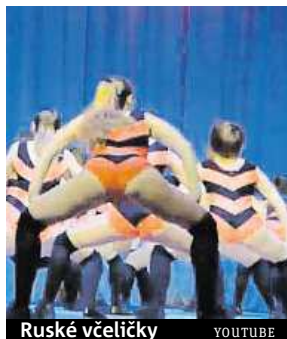
Ruské včeličky YOUTUBE

Sexy tanec twerk ruských šolaček pobouřil tamní politiky. Škole hrozí i soudem.