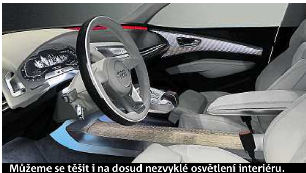
Můžeme se těšit i na dosud nezvyklé osvětlení interiéru.