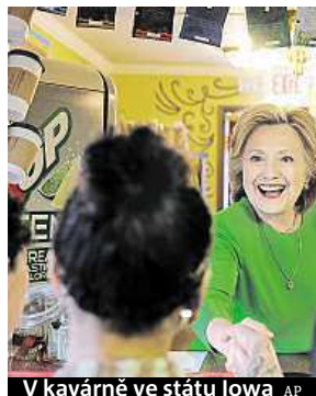
V kavárně ve státu Iowa

akcentují její slabiny. „Clintonová zosobňuje minulé a všechny současné chyby Obamovy vlády,“ nechal se slyšet jeden z republikánských kandidátů Marco Rubio, syn kubánských přistěhovalců. Bývalá senátorka totiž vedla ministerstvo zahraničí právě za Obamovy vlády v letech 2009 až 2013 a i dnes podporuje Obamovu hospodářskou „levicovou“ politiku. „Dopustíte třikrát za sebou vládu Baracka Obamy, nebo jste připraveni na silné vedení konzervativců, kteří USA vrátí na místo, kam patří?“ ptal se další re-