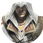
Pedro Auditore Da Firenze Vůbec ne, bude spíš komplikovaně vidět zajímavé zápasy.