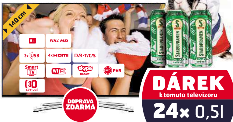
3D FULL HD SMART LED TELEVIZOR SAMSUNG UE55H6270

• hodnotné materiály • odladěný operační systém • výkon na internet i hraní her (270077, 321008)