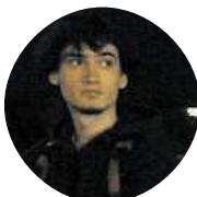
Jeníček Z Větrného Města Život v Praze komplikují pouze nápady Řopidu.