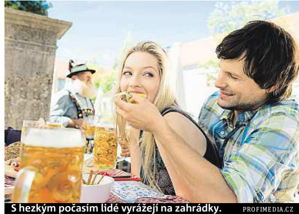
S hezkým počasím lidé vyražejí na zahrádky.

Právě této radnici plynou každoročně z restauračních zahrádek příjmy okolo sto milionů korun. Radnice v jiných městech naopak od poplatků upustily (více v boxu). „Důvodem pro zrušení před více než šesti lety byla podpora podnikání a cestovního ru-