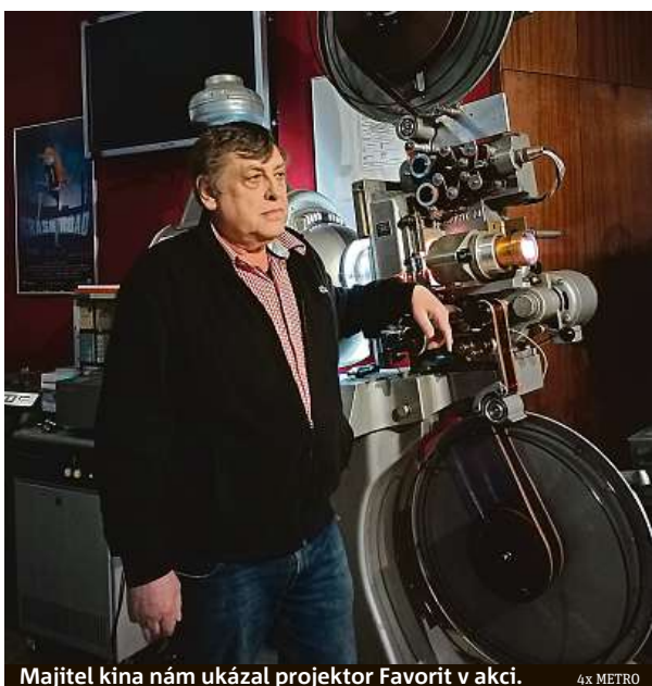
Majitel kina nám ukázal projektor Favorit v akci.

„Kupoval jsem to hlavně z důvodu zachování původní projekční techniky. Bylo mi řečeno, že koupit celé kino je snazší než kupovat jen tu