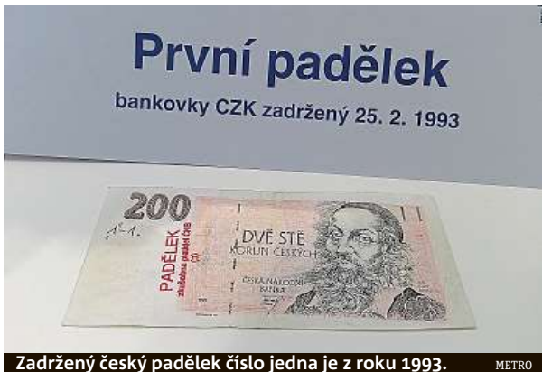
Zadrženy český padělek číslo jedna je z roku 1993.

Nejen v Česku se bankovní papír vyrábí i z použité bavlny. Což není žádné tajemství, ale pro padělatele se jedná o proces, který je mimořádně náročný, drahý a v „domácích“ podmínkách těžko napodobitelný. Prý však stačí obyčejný papír do tiskárny namočit do mléka a pro další