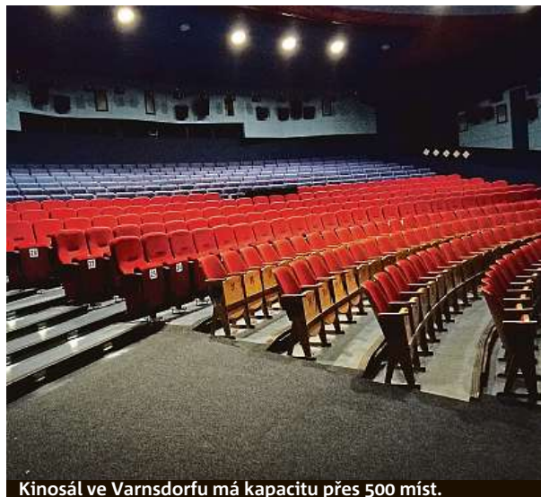
Kinosál ve Varnsdorfu má kapacitu přes 500 míst.

Rozhodl se tedy, že naváže na historii výroby svého otce, a provoz následně obnovil. V devadesátých letech byl o neonové reklamy velký zájem, což znovuotevřenému podniku prospělo. „Neon se stále používá, pořád ho vyrábíme, nedávno jsme dělali třeba rekonstrukci neonu na Bílé labuti nebo rekonstrukci neonů na plastiku Zdeňka Pešánka z třicátých let,“ uzavírá pro Metro Nejtek a doplňuje, že neonová svítidla z jeho výroby zdobí i vnitřní prostory kina. ANEŽKA VONDRÁKOVÁ