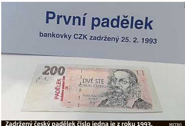
Zadrženy český padělek číslo jedna je z roku 1993.

Nejen v Česku se bankovní papír vyrábí i z použité bavlny. Což není žádné tajemství, ale pro padělatele se jedná o proces, který je mimořádně náročný, drahý a v „domácích“ podmínkách těžko napodobitelný. Prý však stačí obyčejný papír do tiskárny namočit do mléka a pro další