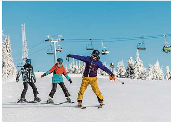
Takhle se ve Špindlerově Mlýně lyžovalo v lednu. Na sjezdovkách je i v těchto dnech několik desítek centimetrů sněhu.

Větší problém je vítr, který dokáže lanovky zastavit na celý den. „Každé dopravní zařízení má své limity, zejména co se týká větru. Pokud jsou tyto limity překročeny, není z bezpečnostních důvodů možné zařízení provozovat. Také záleží na směru větru, některé lanovky mají lepší odolnost vůči čelnímu větru, některé vůči bočnímu,“ říká Hroneš.