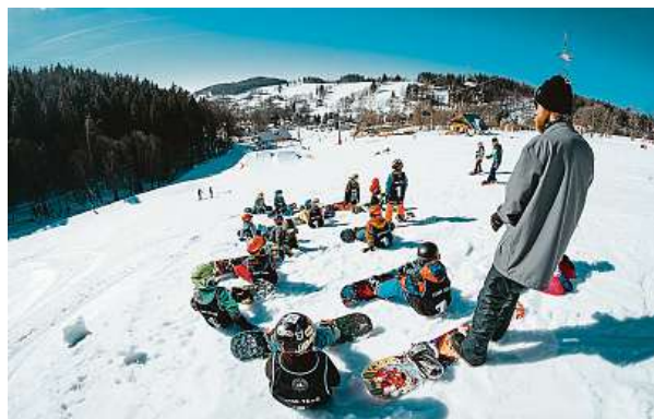
Děti můžete učit i na snowboardu, ale vždy je dobré si najmout odborné instruktory.

Než vyrazíte na hory, pečlivě si zkontrolujte lyžařskou a snowboardovou výbavu. Lyže a snowboard svěďte do péče servisu, kde se o ně profesionálně postarají, a vy budete mít jistotu, že jsou v pořádku. Stejnou péči věnujte i dětské výbavě. „Řekněte ne zmenšeninám a těžkým prkům či lyžím. Jistě jste slyšeli upozornění, že dítě není malý dospělý. Proto pro ně nejsou vhodné snowboardy, které jsou pouhou zmenšeninou dospěláckých. Prkno pro dospělé má určitou tloušťku, která je adekvátní jejich výšce. Pokud se takový snowboard zmenší na výšku dítěte, bude příliš těžký a dítě