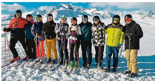
Lyžování je i v těchto týdnech při jarních prázdninách oblíbenou činností mnoha lidí.

Aby vám na sjezdovce bylo dobře, je třeba se správně obléknout. Je ideální oblečení vrstvit, a to tak, aby bylo možné vrstvu ubrat. Chybět by nemělo termo oblečení, fleecová či klasická mikina, ponožky dobře odvádějící pot a kvalitní nepromokavé lyžařské kalhoty, bunda nebo kombinéza. PAVEL URBAN