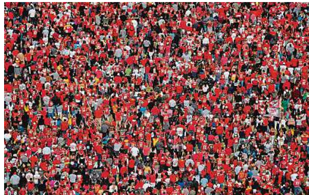
Po oslavě vítězství amerických fotbalistů Kansas City Chiefs v Super Bowlu byl zabit jeden člověk a dalších 21 lidí bylo zraněno.

„Modlím se za Kansas City,“ napsal na sociálních sítích hvězdný rozehrávač Patrick Mahomes, který v nedělním Super Bowlu dovedl Chiefs k vítězství 25:22 po prodloužení nad San Franciscem. Kansas City obhájilo loňský triumf, získalo čtvrtý