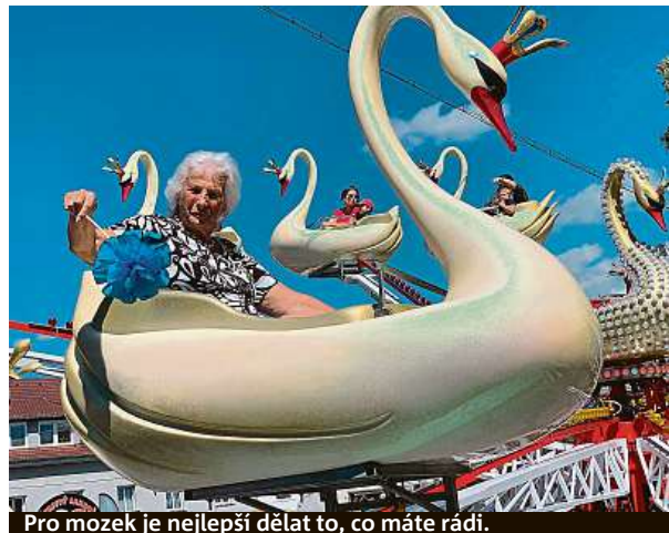
Pro mozek je nejlepší dělat to, co máte rádi.