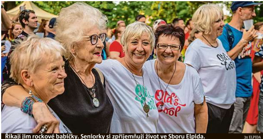
Ríkají jim rockové babičky. Seniorky si zpřijemňují život ve Sboru Elpida.

„Je určitě dobré být připravený na to, že budeme mít nižší příjem, a snažit se včas odkládat si měsíčně alespoň malou částku,“ doporučuje Hrabě. Zvážit bychom měli také bydlení. „Když si pořizujeme dům či byt, je dobré myslet na to, zda v něm budu moci i zestárnout. Třeba zda a jak je vyřešen přístup do patra, protože den, kdy nevyjdou po schodech, prostě přijde,“