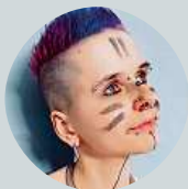
Ivča Niemczyk Hádky jsou super, ale sex po hádce ještě lepší.