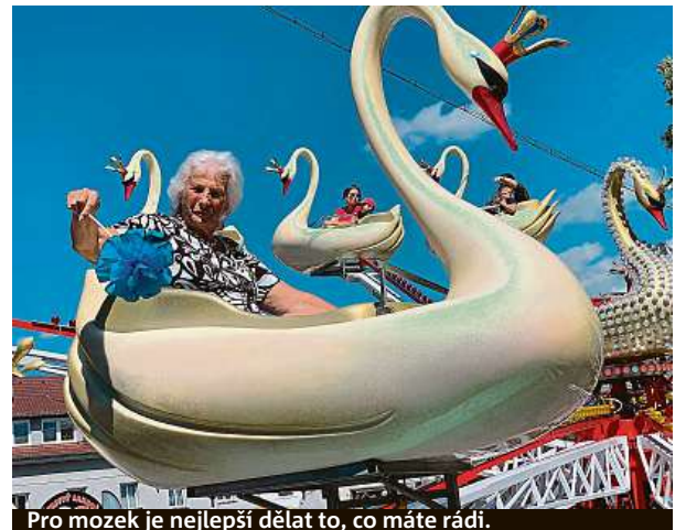
Pro mozek je nejlepší dělat to, co máte rádi.