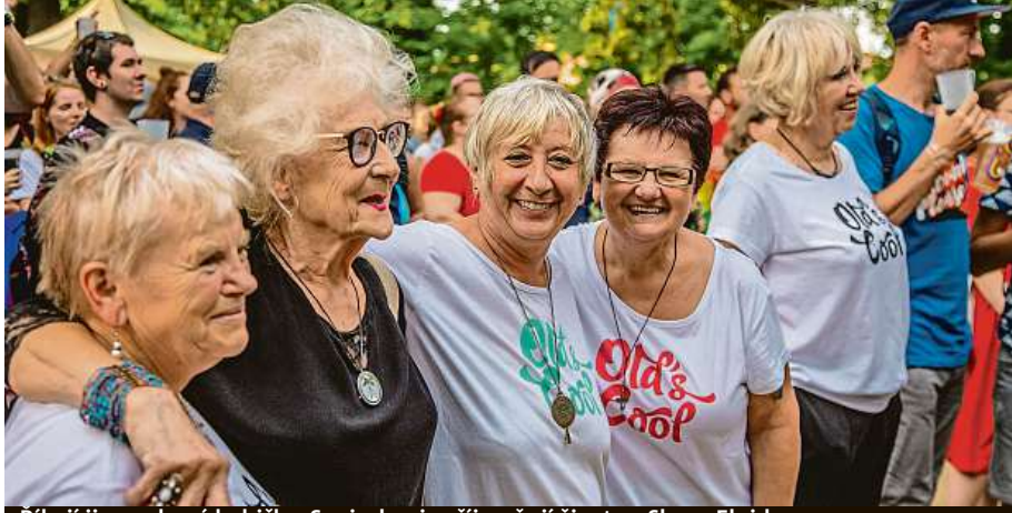
Ríkají jim rockové babičky. Seniorky si zpřjemňují život ve Sboru Elpida.

„Je určitě dobré být připravený na to, že budeme mít nižší příjem, a snažit se včas odkládat si měsíčně alespoň malou částku,“ doporučuje Hrabě. Zvážit bychom měli také bydlení. „Když si pořizujeme dům či byt, je dobré myslet na to, zda v něm budu moci i zestárnout. Třeba zda a jak je vyřešen přístup do patra, protože den, kdy nevyjdou po schodech, prostě přijde.“