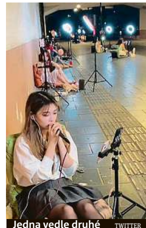
Jedna vedle druhé TWITTER

lokalizace z GPS posuzuje jako obyvatele těchto prestižních míst a jejich vysílání doporučuje uživatelům z obdobně luxusních adres,“ vysvětluje Washington Post.