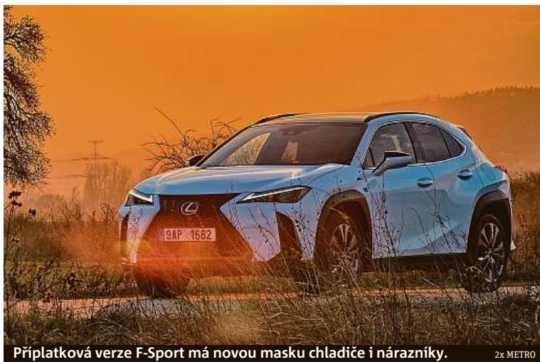
Příplatková verze F-Sport má novou masku chladiče i nárazníky. 2x METRO