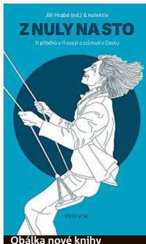
Obálka nové knihy