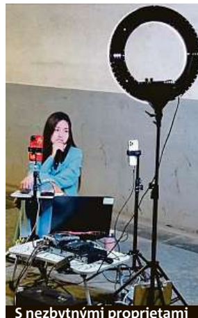
S nezbytnými proprietami

V drtivé většině se tato podnikavá mládež nalézá na těch nejprestižnějších adresách, třeba i v nejbližším okolí pekingského Zakázaného města. Důvod? „Algoritmus sociálních sítí je na základě