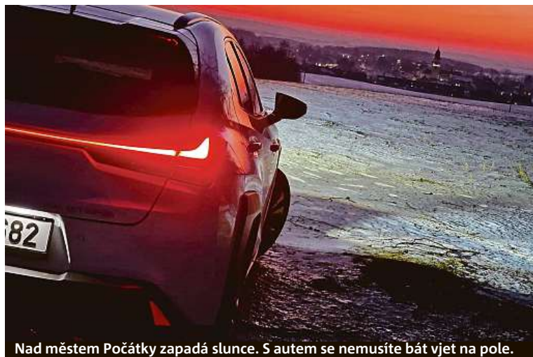
Nad městem Počátky zapadá slunce. S autem se nemusíte bát vjet na pole.