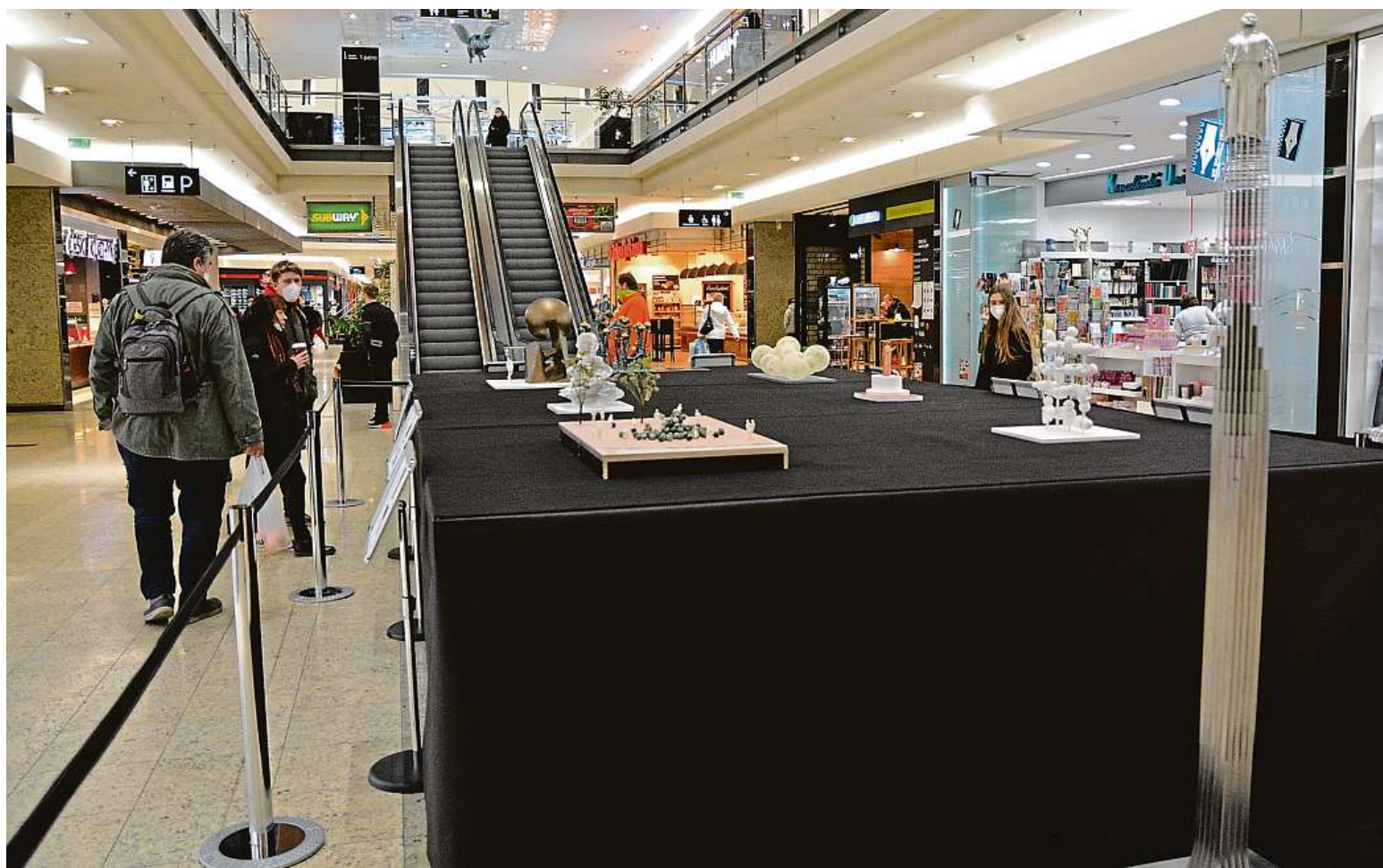
Výstava v Galerii Vaňkovka představuje všech osm návrhů včetně vysokého sloupu, který měl z určitých úhlů pohledu vytvářet iluzi levitace.