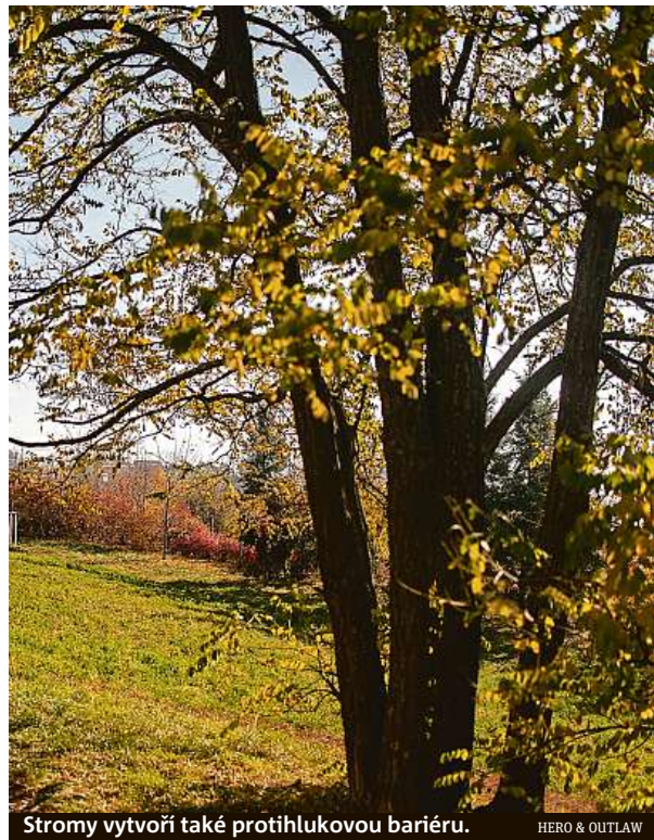
Stromy vytvoří také protihlukovou bariéru.

Postupnou proměnu prochází i přilehlá průmyslová zóna. Po dokončení bude areál zahrnovat přibližně 150 tisíc metrů čtverečních pronajimatelné plochy a vznikne zde až tři tisíce pracovních míst. CTP proměňuje s podporou proslulého výrobce a místní samosprávy bývalý výrobní areál Zetoru v moderní obchodní park v širším centru města, náklady na něj dle odhadu společnosti dosáhnou zhruba tří miliard korun. Areál bude určen pro e-commerce, lehkou průmyslovou výrobu, městskou logistiku, ale i pro maloobchod nebo výzkum a vývoj. Kompletní dokončení očekává investor na přelomu let 2024 a 2025. RADEK BABIČKA