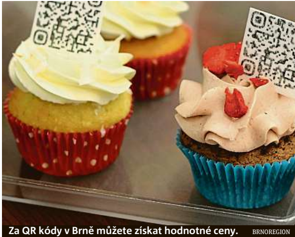
Za QR kódy v Brně můžete získat hodnotné ceny. BRNOREGION

Registrovat se do soutěže lze na webu micromacro.cz. Hráči sbírají body jak za zodpovězené otázky přímo na webu, tak za snímání QR kódů rozetých po Brně. Ty se nacházejí třeba v kině, planetáriu, klubech, barech, cukrárnách i kavárnách. „Spousta lidí si neuvědomuje, že se výsledky výzkumu a práce v elektronové mikroskopii