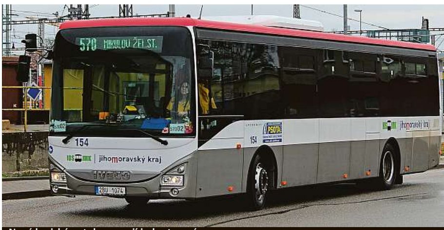
Nové krajské autobusy mají jednotnou úpravu.

Nový dopravce začal jezdit zejména na Hustopečsku, Břeclavsku a Židlochovicu – značnou část této oblasti nyní obsluhuje ČSAD Kyjov. Na Ivančicku vyjíždí dopravce TRADO-BUS a na Šlapanicích některé linky přebírá BDS-BUS. Změny nemají vliv na ceny jízdného, protože o nich rozhoduje Jihomoravský kraj. Novinkou v jízdních řádech je například dlouhodobě připravovaná úprava trasy linky 505, která nově