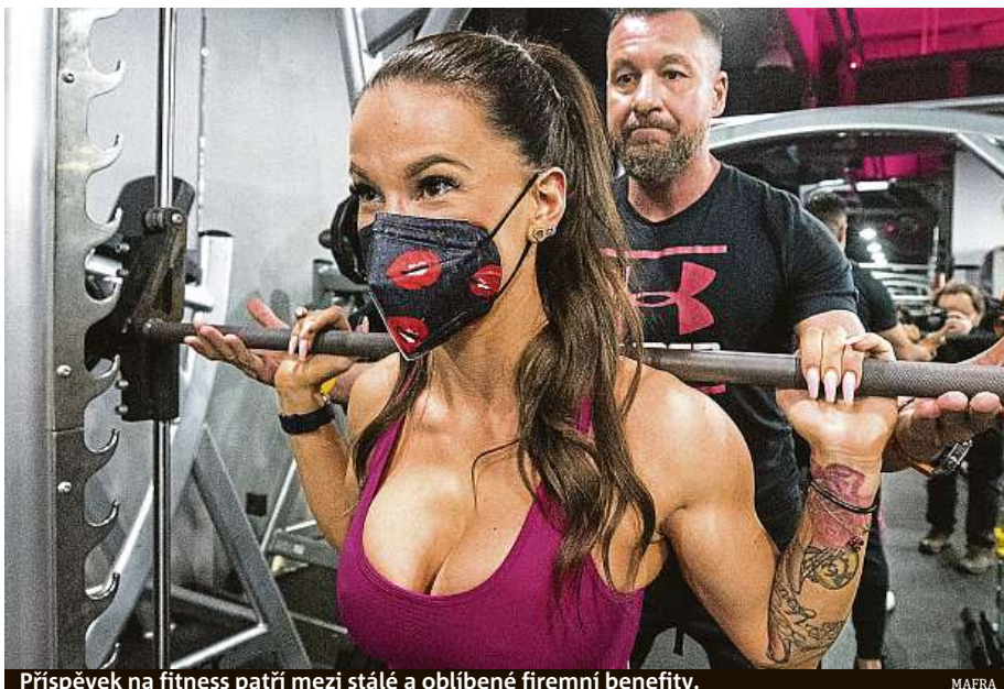
Příspěvek na fitness patří mezi stálé a oblíbené firemní benefity.

„Další novinkou, na kterou se mohou zaměstnanci těšit, je dvoudenní dovolená navíc pro každého, kdo ve firmě působí minimálně pět let,“ říká