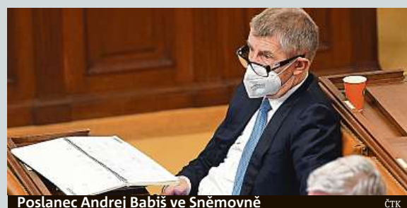
Poslanec Andrej Babiš ve Sněmovně