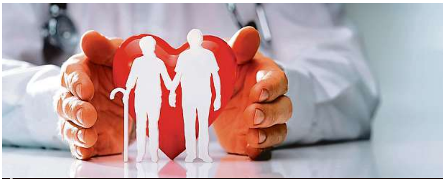
Životní pojištění se dá nastavit tak, aby bylo smysluplné.

Může poměrně rychle ušetřit nemalé peníze. Bývalo totiž běžnou praxí, že se pojistné na pojistných smlouvách navyšovalo a zaokrouhlovalo. Důvodem byla často vyšší provize pro zprostředkovatele