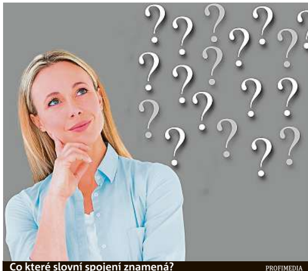
Co které slovní spojení znamená?