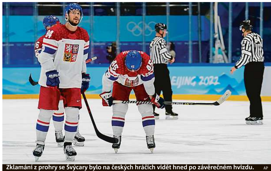
Zklamání z prohry se Švýcarsy bylo na českých hráčích vidět hned po závěrečném hvizdu.

Čeští hokejisté prohráli v předkole play-off na ZOH se Švýcarskem 2:4, poprvé v historii nepostoupili do čtvrtfinále a připisali si nejhorší výsledek na turnaji pod pěti kruhy od rozdělení Československa. Po gólu Lukáše Kloka v 11. minutě sice vedli, ale pak se čtyřikrát prosadili Švýcaři – góly na 1:2 dali v rozmezí 13 vteřin. Čtyři minuty před koncem pouze snížil Roman Červenka. Svěřenci trenéra Filipa Pešána, jehož další působení na střídačce národního týmu bude vedení Českého svazu ledního hokeje řešit příští týden, se s olympiádou rozloučili s bilancí dvou výher – po nájezdech a v prodloužení – a dvou porážek. SM