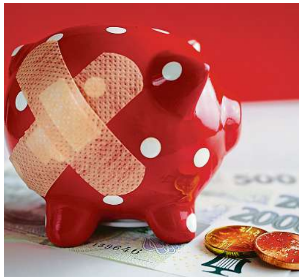
Životní pojištění může být velmi variabilní.

„Životní pojištění může být opravdu velmi variabilní. Klient se může rozhodovat o změně jeho parametrů i v průběhu pojištění, například má možnost právě snižovat, či zvyšovat pojistnou částku či pojistné, přidávat, či odebrat připojištění, může dokonce měnit i pojistnou dobu, jednoduše přizpůsobuje životní pojištění své momentální potřebě a aktuální životní situaci,“ dodává Koblížek. SPUS2