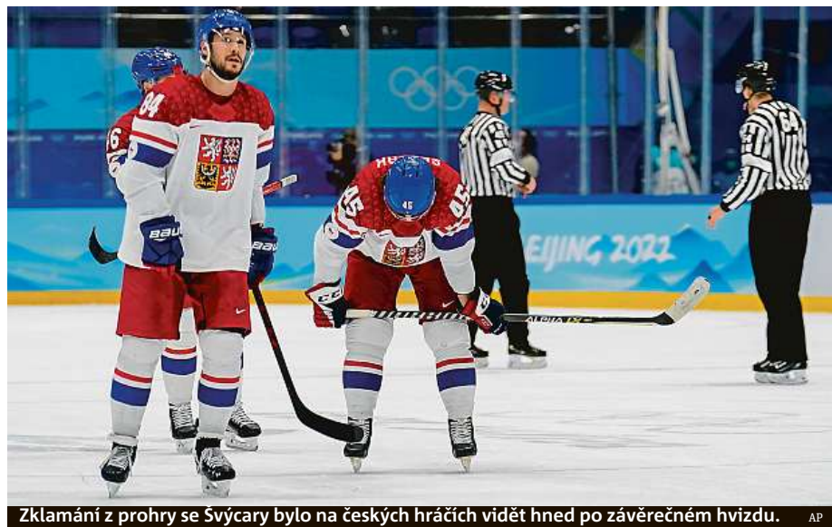
Zklamání z prohry se Švýcary bylo na českých hráčích vidět hned po závěrečném hvizdu.

Čeští hokejisté prohráli v předkole play-off na ZOH se Švýcarskem 2:4, poprvé v historii nepostoupili do čtvrtfinále a připsali si nejhorší výsledek na turnaji pod pěti kruhy od rozdělení Československa. Po gólu Lukáše Kloka v 11. minutě sice vedli, ale pak se čtyřikrát prosadili Švýcaři – góly na 1:2 dali v rozmezí 13 vteřin. Čtyři minuty před koncem pouze snížil Roman Červenka. Svěřenci trenéra Filipa Pešána, jehož další působení na střídačce národního týmu bude vedení Českého svazu ledního hokeje řešit příští týden, se s olympiádou rozloučili s bilancí dvou výher – po nájezdech a v prodloužení – a dvou porážek. SM