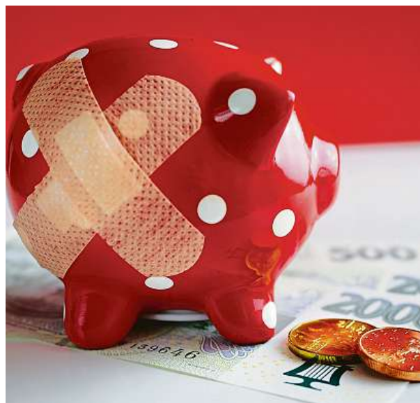
Životní pojištění může být velmi variabilní.

„Životní pojištění může být opravdu velmi variabilní. Klient se může rozhodovat o změně jeho parametrů i v průběhu pojištění, například má možnost právě snižovat, či zvyšovat pojistnou částku či pojistné, přidávat, či odebrat připojištění, může dokonce měnit i pojistnou dobu, jednoduše přizpůsobuje životní pojištění své momentální potřebě a aktuální životní situaci,“ dodává Koblížek. SPUS2