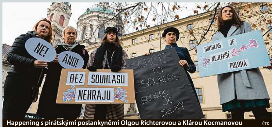
Happening s pirátskými poslankyněmi Olgou Richterovou a Klárou Kocmanovou

V Praze na Malostranském náměstí se konal happening ke kampani Chce to souhlas, která má za cíl nápravu nedostatečné definice znásilnění v zákoně. U příležitosti ročního výročí od startu kampaně Chce to souhlas chtějí organizace politikům a politikům připomenout, že sex bez souhlasu je znásilnění a že jeho současná definice nestačí. IDNES.cz