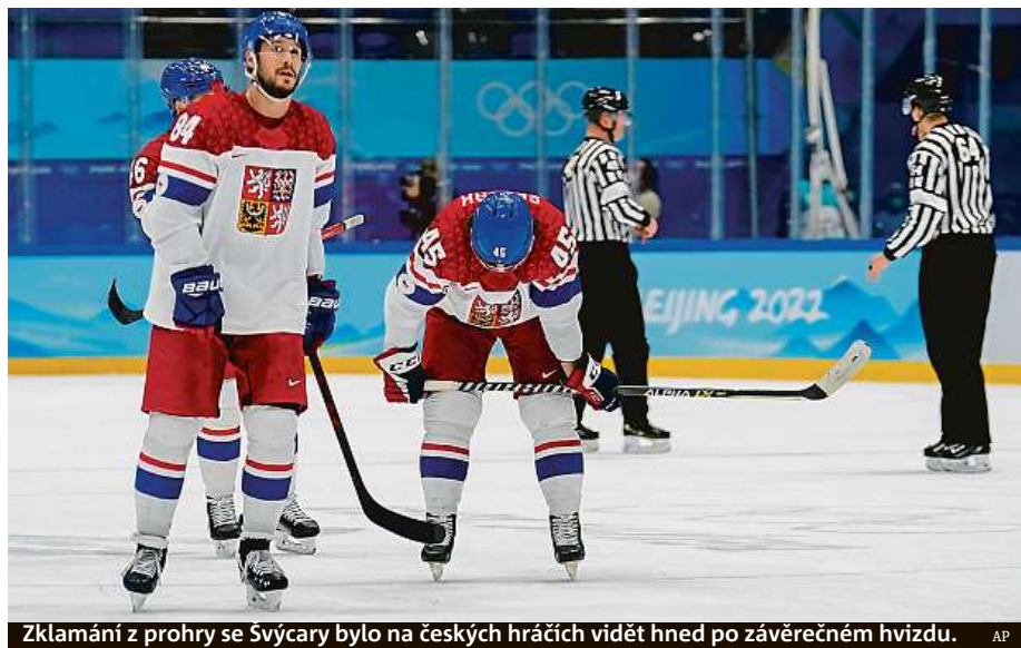
Zklamání z prohry se Švýcary bylo na českých hráčích vidět hned po závěrečném hvizdu.

Čeští hokejisté prohráli v předkole play-off na ZOH se Švýcarskem 2:4, poprvé v historii nepostoupili do čtvrtfinále a připsali si nejhorší výsledek na turnaji pod pěti kruhy od rozdělení Československa. Po gólu Lukáše Kloka v 11. minutě sice vedli, ale pak se čtyřikrát prosadili Švýcaři – góly na 1:2 dali v rozmezí 13 vteřin. Čtyři minuty před koncem pouze snížil Roman Červenka. Svěřenci trenéra Filipa Pešána, jehož další působení na střídačce národního týmu bude vedení Českého svazu ledního hokeje řešit příští týden, se s olympiádou rozloučili s bilancí dvou výher – po nájezdech a v prodloužení – a dvou porážek. SM