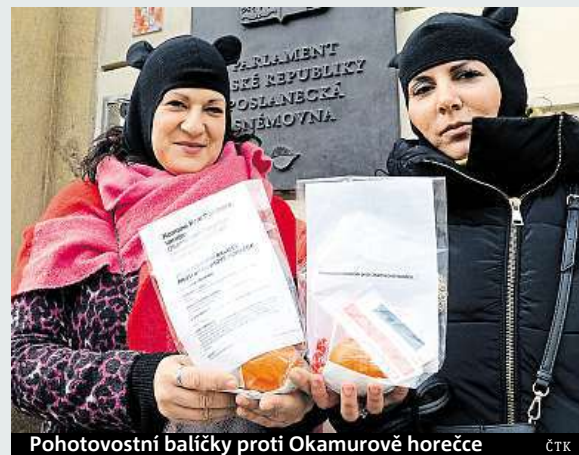
Pohotovostní balíčky proti Okamurově horečce