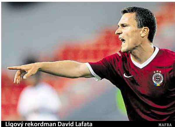
Ligový rekordman David Lafata

Druhá Slavia má po podzimu daleko k obhajobě titulu a vedení klubu sáhlo k razantním změnám. Především změnilo trenéra a místo Jaroslava Šilhavého přetáhlo z Liberce Jindřicha Trpišovského, který s sebou přivedl i hráče Ondřeje Kúdela a Ondřeje Koláře. Z Francie přišel stoper Lukáš Pokorný a do útoku se vrátil z Jablonce druhý nejlepší střelec ligy Stanislav