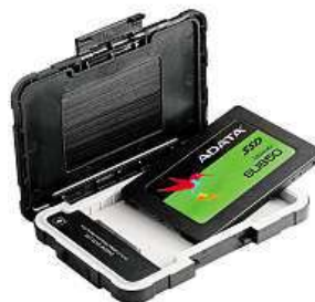
ADATA ED600 MIRONET

Pro připojení k dalším zařízením box využívá rychlé rozhraní USB 3.1 umožňující dosáhnout přenosové rychlosti až 5 Gb/s. Kabel k propojení je navíc součástí balení. Pro čas-