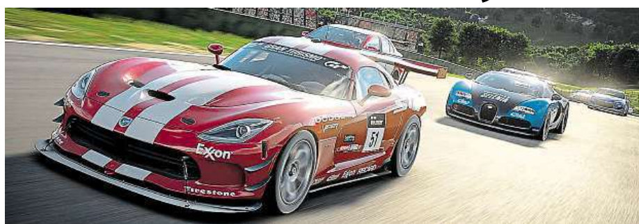
Závodní simulátor Gran Turismo Sport

Před necelými dvěma týdny jsme vás jako první informovali o možnosti zlevnit si pomocí slevového kódu PlayStation 4, a to rovnou o tisíc korun. Pro velký zájem připravil IT e-shop Mironet novou akci zaměřenou tentokrát na virtuální automobilové závody. Díky ní si můžete až do 25. února pořídit jeden z nejlepších závodních simulátorů Gran Turismo Sport na PS4 spolu s originálním ovladačem DualShock v edici GTS o 500 korun levněji. Jiné, co pro to musíte udělat, je vyhledat na stránkách obchodu kód produktu