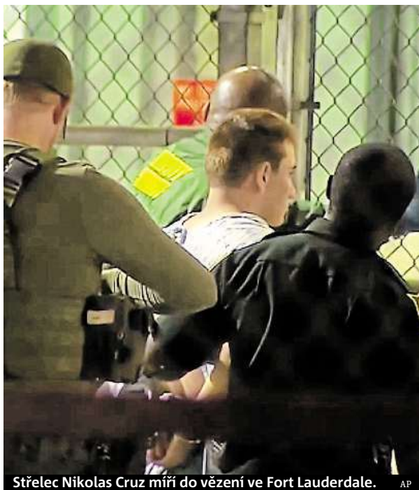
Střelec Nikolas Cruz míří do vězení ve Fort Lauderdale.

Jeden ze studentů řekl, že Cruz byl ze školy v Parklandu vyloučen v minulém školním roce po rvačce a přešel na jinou školu v tomtéž floridském okrese Broward. Cruz se porval s novým přítelem dívky, s níž předtím chodil, a škola ho vyloučila z kázeňských důvodů. Úřady v okrese Broward vědí, že Cruz byl po určitou dobu v péči psychiatrické kliniky. Více než rok tam ale už nedocházel.