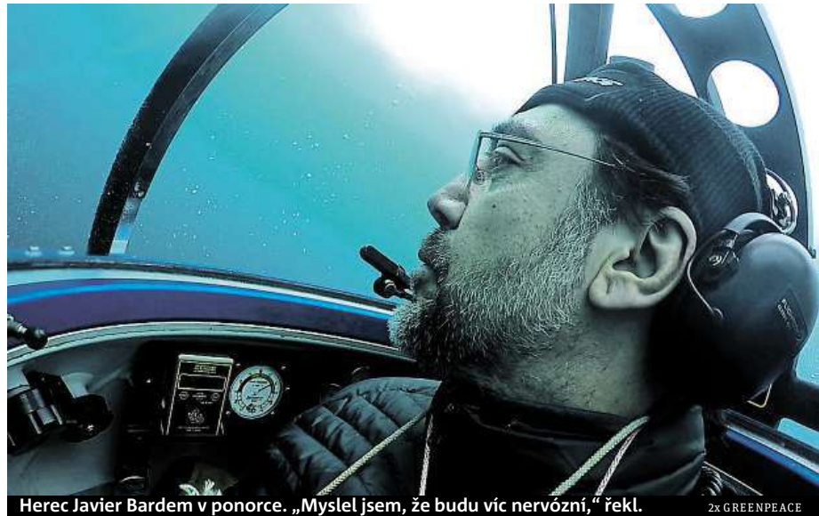
Herec Javier Bardem v ponorce. „Myslel jsem, že budu víc nervózní,“ řekl.