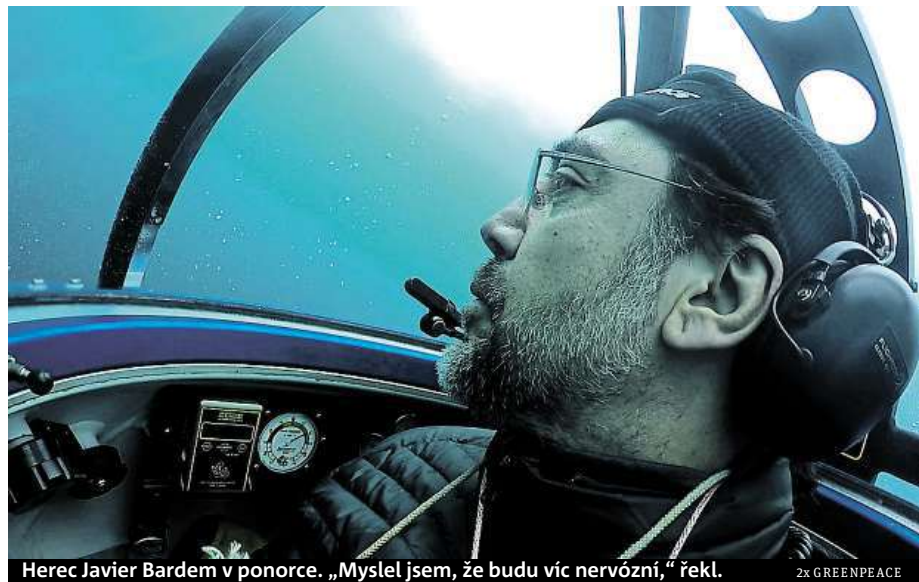
Herec Javier Bardem v ponorce. „Myslel jsem, že budu víc nervózní,“ řekl.