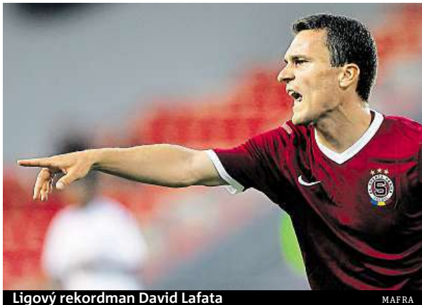
Ligový rekordman David Lafata

Ve stínu zimních olympijských her zítra odstartuje jarní část první fotbalové ligy.