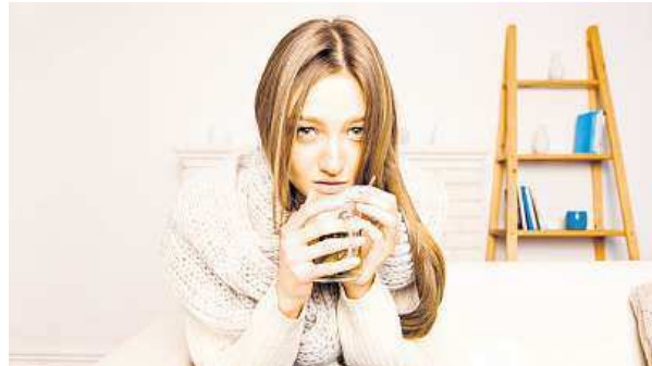
S chřipkou si není radno zahrávat.