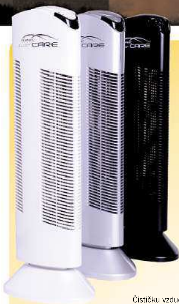
Čističku vzduchu Ionic-CARE Triton X6 můžete zakoupit ve třech barevných provedeních.

Ostrov čistého vzduchu v moři smogu a škodlivin!