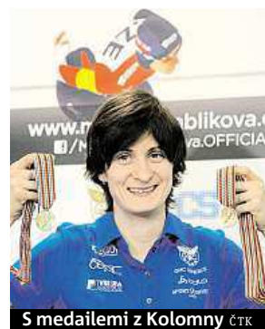
5 medailemi z Kolomny

Na mistrovství světa v Kolomně udělala další krok k tomu, aby se nesmazatelně zapsala do historie.