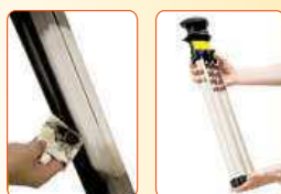
Filtry není třeba nikdy vyměňovat! Stačí je jen občas jednoduše vyjmout a otřít. Účinek filtrace ihned vidíte!

Až 70 % Čechů dýchá škodlivý vzduch! Od roku 2006 zemřelo kvůli znečištěnému ovzduší bezmála 34 tisíc Čechů a další tisíce lidí se musely léčit v nemocnicích. Vysoké koncentrace polévatého prachu, chemikálií a jiných nečistot vážně ohrožují naše zdraví. Hygienici v těchto dnech bijí na poplach a doporučují nevětrat. Je ale prostředí v uzavřené místnosti skutečně zdravější než to venkovní?