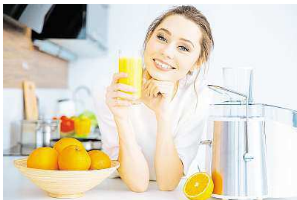
Posílit imunitu můžete třeba pomocí vitaminů.

Základem imunity je dobře fungující střevní mikroflóra. Probiotika mají důležitou úlohu v našem zažívacím traktu. Příznivě ovlivňují nejen trávení, ale také stimulují imunitní systém. Při správném množství a složení navozují