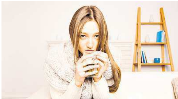
S chřipkou si není radno zahrávat.

Kdo nemoc přechází, může si zadělat na pěkné nepříjemnosti. S chřipkou si není radno zahrávat. „Pokud se chřipka neléčí, výrazně se zvyšuje riziko komplikací, jako jsou virové i bakteriální zápal plic, záněty srdcového svalu, mozkových blan, nosních dutin i plic,“ říká lékařka Barbora Hirnerová z Polikliniky Agel Praha. KAMILA HUDEČKOVÁ