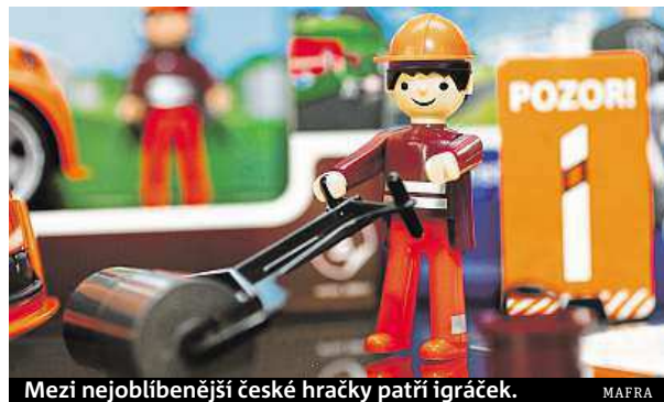
Mezi nejoblíbenější české hračky patří igraček.

Positivní reakce na české výrobky potvrdil také veletrh Spielwarenmesse v Norimberku, kde Češi představili nové produkty pro rok 2016. Jde