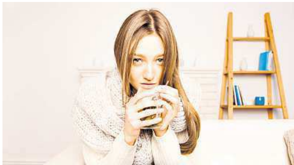
S chřipkou si není radno zahrávat.