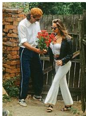
Legendární Irenka dorazila. Copak asi dostane darem?

Nyní se mohu alespoň vymlouvat na to, že jsem byl dítě. Někdejší kritická obec ale svého času filmu také docela dost naložila, stejně tak jako všemožní intelektuálové, kteří nenahlédli za oponu geniality živočišného scénáře Věry Chytilové a Bolka Polívky, i hereckým výkonům všech zúčastněných. A jak