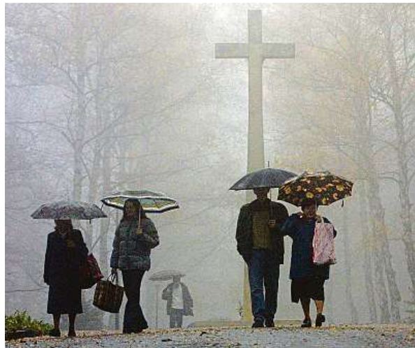
Fotografové mají nostalgickou a tajemnou atmosféru s mlhou v zimě rádi. Lidská psychika si s ní ale často neví rady.

I bez toho ale je realitou, že pro mnoho lidí je počátek nového roku a zima vůbec ne vždy optimistickým obdobím. Podle čerstvého průzkumu KB Pojišťovny mezi více než tisícovkou dospělých Čechů je zima nejméně oblíbeným obdobím.