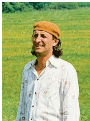
Bohumil Stejskal – nejkoničtější role Bolka Polívky 3x BIOSCOP

Obliba snímku Dědictví se u mě, stejně jako o mnoha dalších tuzemských diváků, nezrodila po prvním zkouknutí. Jak praví jiní a podstatně zkušenější filmoví fajnšmekři, žádný jiný český porevoluční snímek nebalancoval tak mistrně a bezprecedentně na hraně mezi genialitou a zoufalstvím. U mě to ovšem ani nemohlo být jinak. V době premiéry snímku mi totiž byly čtyři roky a v dobách, kdy snímek můj táta nakoukával prostřednictvím půjčené videokazety, a později v televizi, na mě ta změt sprostých hlášek o „rozhození sandálu“ (čimž bylo míněno fyzické násilí na druhé osobě), p*če, kterou podobně jako boha nikdo nikdy ne