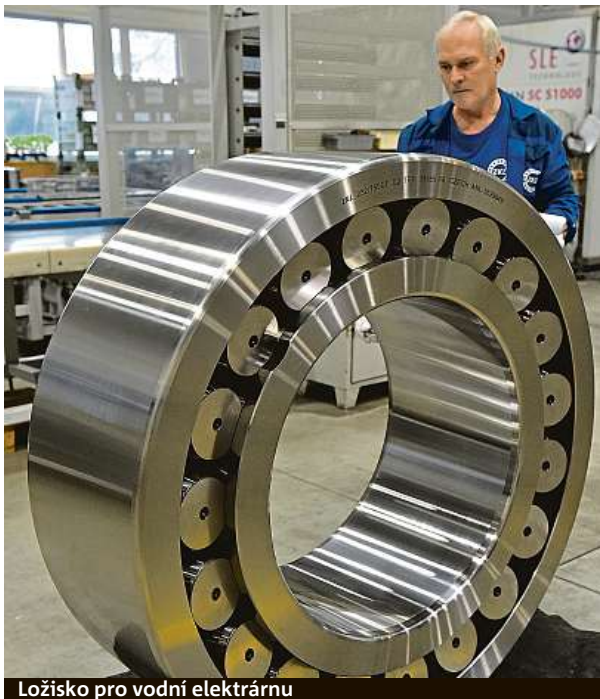
Ložisko pro vodní elektrárnu

Přeprava potvrzuje několik dní. Ložisko se přepravuje ve speciálním obalu přizpůsobeném jeho hmotnosti. „Náš