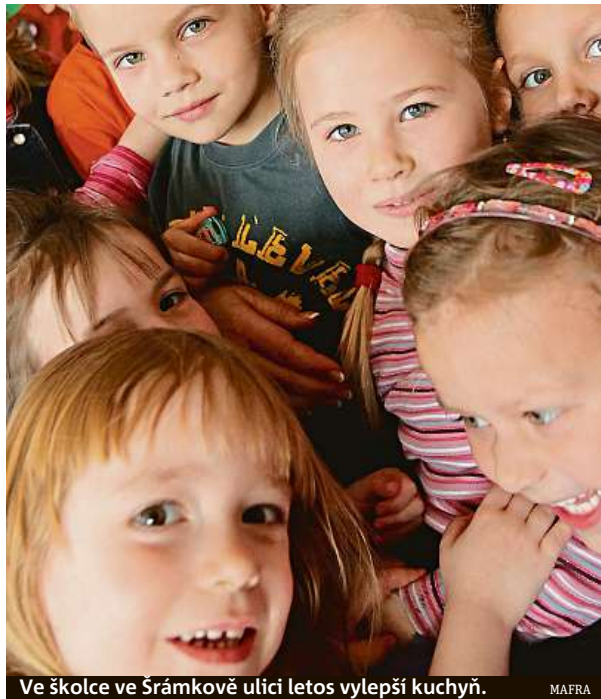
Ve školce ve Šrámkově ulici letos vylepší kuchyň.

Kromě investic dává Brno peníze i do podpory technického vzdělávání. „Naším cílem je podporovat v dětech jejich talent už v raném věku. Chceme v nich probouzet zvědavost, praktické dovednosti, ale také kladný vztah ke sportu,“ uvedl Suchý. Dva miliony dá město na zajištění plaveckého výcviku, s krajem chystá pojízdnou laboratoř nazvanou Fab lab, ve které si mohou studenti vyzkoušet praktické činnosti i moderní technologie jako 3D tiskárnu. Dalším projektem je vědecké výukové centrum Bioskop. Peníze se použijí i na kurzy etické výchovy na základních školách nebo na dietní stravování dětí, které mají lékařem stanovenou dietu. čtk