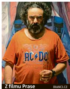
Z filmu Prase

Program je dostupný na stránkách www.iranci.cz . Na webu je také možné zakoupit v předprodeji vstupenky. MET