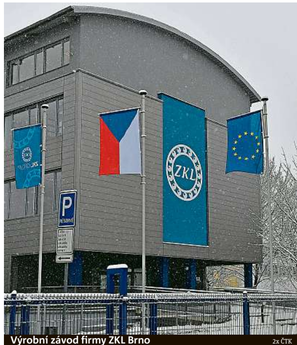
Výrobní závod firmy ZKL Brno

kových ložisek. Velkorozměrová ložiska se tady vyrábějí průběžně celý rok pro významné zákazníky z celého