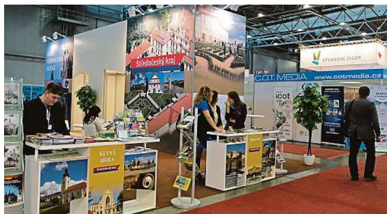
Na veletrhu Regiontour se prezentují jednotlivé kraje.