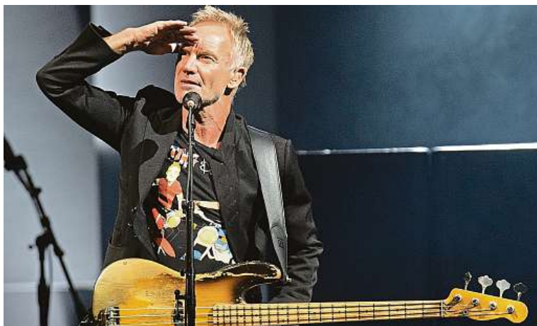
Angličan Sting letos zazpívá 12. července ve Slavkově u Brna.