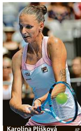
Karolína Plíšková

O pár hodin později uspěla i její sestra Kristýna po výhře nad Ruskou Annou Blinkovovou 7:6, 2:6 a 6:2. Kristýna Plíšková nasázela tři-