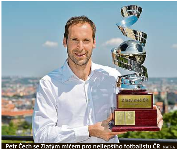
Petr Čech se Zlatým míčem pro nejlepšího fotbalistu ČR MAFA

Během bohaté kariéry chytil Čech také za Chelsea, Rennes nebo Spartu. Rekordman v počtu startů za český národní tým (124) do Arsenalu přišel v roce 2015 z Chelsea, kde strávil jedenáct let. Aktuální sezonu začal jako jednička Kanonýrů, ale po zranění musel přepustit místo v brance Němci Berndu Lenovi. V tomto ročníku tak plzeňský rodák odchytal za Arsenal jen