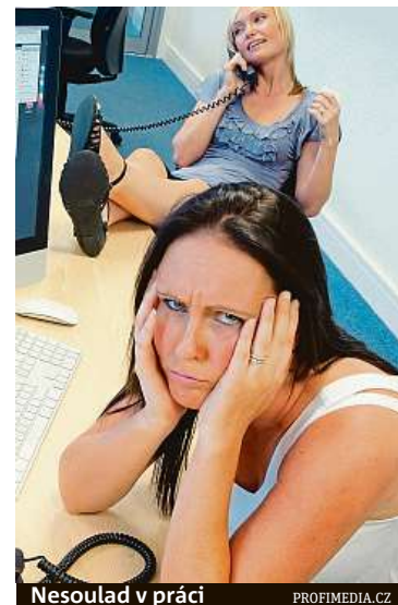
Nesoulad v práci