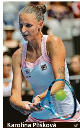
Karolína Plíšková