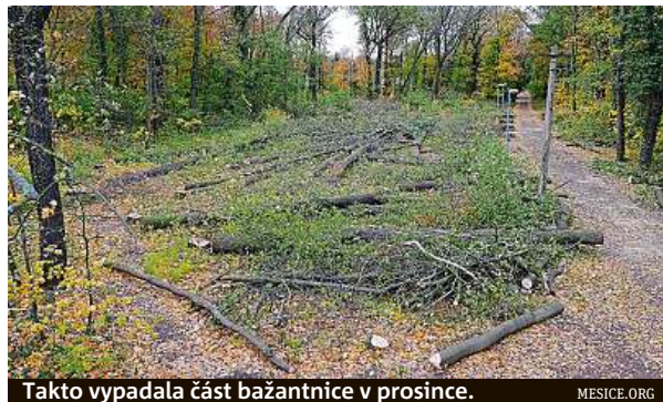
Takto vypadala část bažantnice v prosinci.