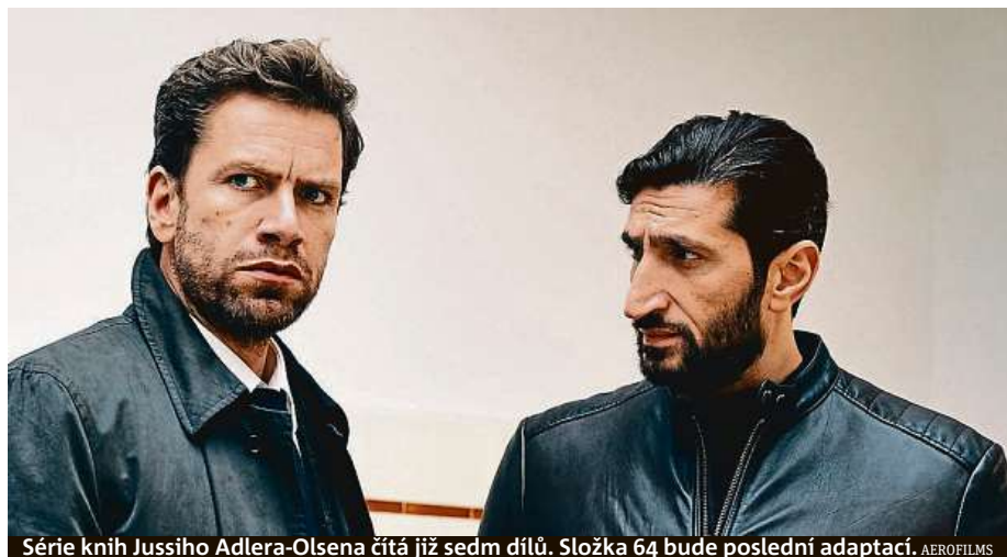
Série knih Jussiho Adlera-Olsena čítá již sedm dílů. Složka 64 bude poslední adaptací.

Diváky, kteří si rádi vychutnají dobrou severskou detektivku, ale dosud nezhledli žádný z předchozích snímků s Carlem a Assadem, musím uklidnit. Pokud jste neviděli Ženu v kleci, Zabijáky ani Vztek v lahvi, nemusíte je před návštěvou kina narychlo doplňovat. Jasně, na začátku se pochopitelně řeší, že spolu hlavní hrdinové mají leccos, ale není těžké se ve vztazích zorientovat. Máme tu pesimistického Carla (Nikolaj Lie Kaas), který se na plátně usmívá jen tehdy, když je pod vlivem drog, a milého sympatáka s muslimskými ko-