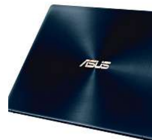
Notebook Asus 2xMIRONET

Pro náročnější práci i hraní novějších her ale poslouží spíše výkonnější verze AsusZenBook UX433FN s označením A5104T. Tento ultrabook pohání čtyřjádro Intel Core i7 s frekvencí až 4,6 GHz doplněné o 16 GB DDR4 RAM a 512 GB SSD M.2. S touto výbavou zvládne ZenBook hravě i náročné úkony. Asus ZenBook UX433FN-A5104T můžete v e-shopu Mironet pořídít za 31 992 korun.