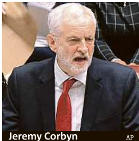
Jeremy Corbyn

Mayová řekla, že nejdříve je potřeba potvrdit, zda má její vláda stále důvěru Dolní