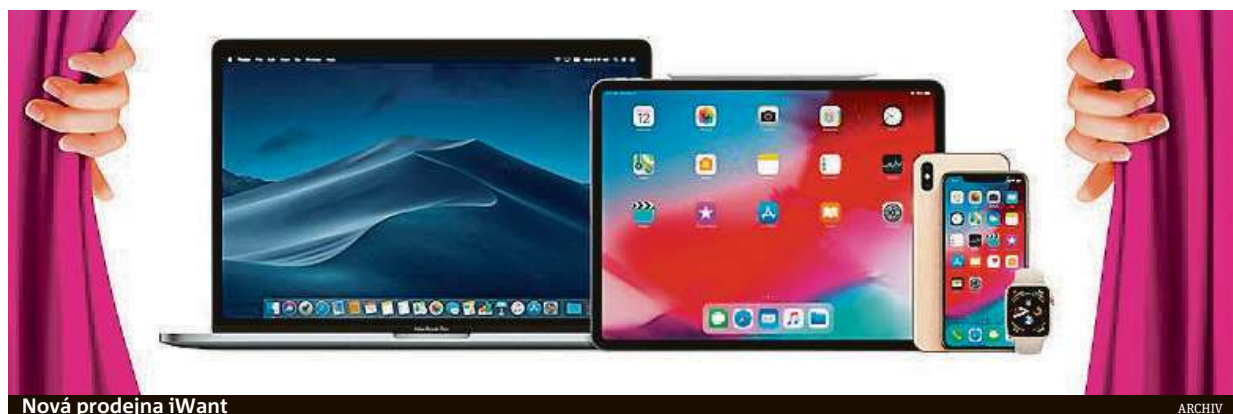
Nová prodejna iWant

Čekání před novou prodejnou vám zpříjemní blogerka Nikol Moravcová a modelka Jitka Nováčková. V zimním čase vás navíc zahřeje horký nápoj dle výběru zdarma. K svému novému produktu si můžete pořídit i značkové příslušenství nebo stylová sluchátka. Pouze během otvíračky totiž pořídíte veškeré příslušenství se slevou 10 procent a sluchátka Beats