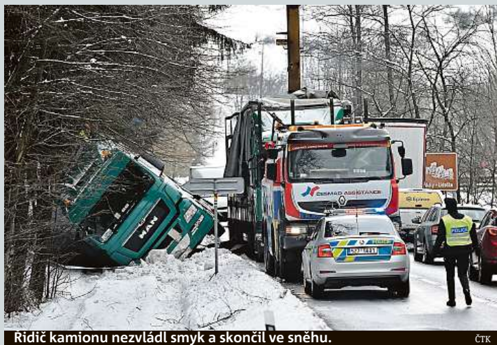
Ridič kamionu nezvládl smyk a skončil ve sněhu.