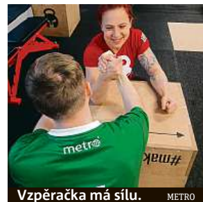
Vzpěračka má sílu.

Arena ale v žádném případě není jen pro zkušené sportovce. Zamakat tu mohou i začátečníci či třeba školáci. „Děti rozhýbáváme, učíme je spolupráci, děláme kotouly a úplně nejvíc si hrajeme,“ usmívá se Kladivová. Jedním dechem dodává, že často už i u dětí musí řešit poruchy pohybového systému. MAREK HÝŘ