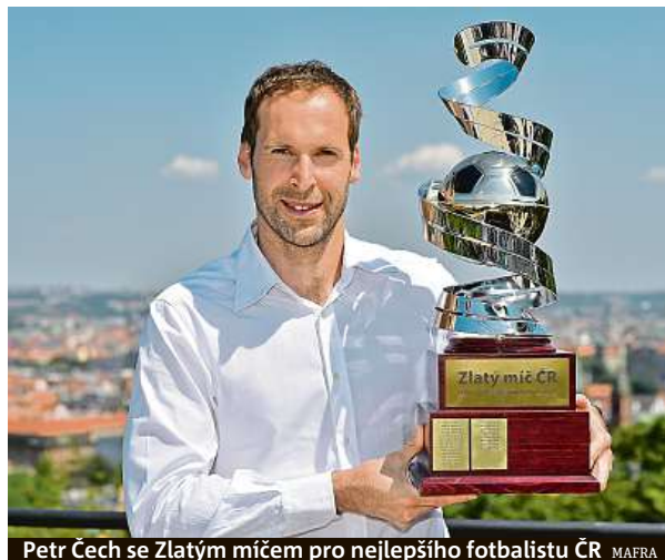
Petr Čech se Zlatým míčem pro nejlepšího fotbalistu ČR MAFA

Během bohaté kariéry chytil Čech také za Chelsea, Rennes nebo Spartu. Rekordman v počtu startů za český národní tým (124) do Arsenalu přišel v roce 2015 z Chelsea, kde strávil jedenáct let. Aktuální sezonu začal jako jednička Kanonýrů, ale po zranění musel přepustit místo v brance Němci Berndu Lenovi. V tomto ročníku tak plzeňský rodák odchytal za Arsenal jen