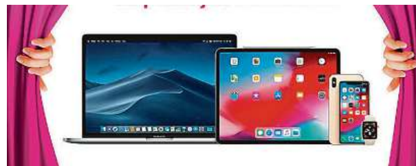
Nový obchod iWant