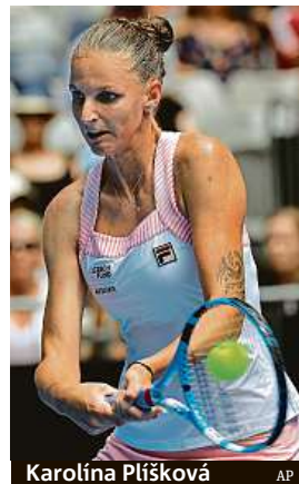
Karolína Plíšková

O pár hodin později uspěla i její sestra Kristýna po výhře nad Ruskou Annou Blinkovovou 7:6, 2:6 a 6:2. Kristýna Plíšková nasázela tři-