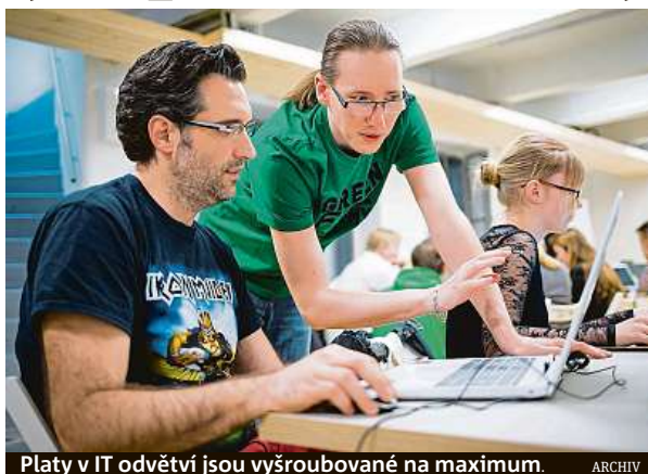
Platy v IT odvětví jsou vyšroubované na maximum.