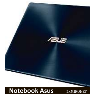
Notebook Asus 2xMIRONET

Pro náročnější práci i hraní novějších her ale poslouží spíše výkonnější verze AsusZenBook UX433FN s označením A5104T. Tento ultrabook pohání čtyřjádro Intel Core i7 s frekvencí až 4,6 GHz doplněné o 16 GB DDR4 RAM a 512 GB SSD M.2. S touto výbavou zvládne ZenBook hravě i náročné úkony. Asus ZenBook UX433FN-A5104T můžete v e-shopu Mironet pořídit za 31 992 korun.