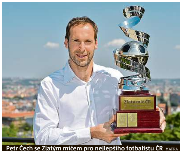
Petr Čech se Zlatým míčem pro nejlepšího fotbalistu ČR

Během bohaté kariéry chytil Čech také za Chelsea, Rennes nebo Spartu. Rekordman v počtu startů za český národní tým (124) do Arsenalu přišel v roce 2015 z Chelsea, kde strávil jedenáct let. Aktuální sezonu začal jako jednička Kanonýrů, ale po zranění musel přepustit místo v brance Němci Berndu Lenovi. V tomto ročníku tak plzeňský rodák odchytal za Arsenal jen