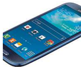
Rozbalený zajímavý kus

V Mironetu můžete koupit také zboží zánovní. Toto zboží může nést mírné známky předchozího používání, ale je naprosto funkční. Jedná se třeba o opravené produkty nebo předváděcí kusy z prodejen. Tyto produkty e-shop nabízí s ještě výraz-