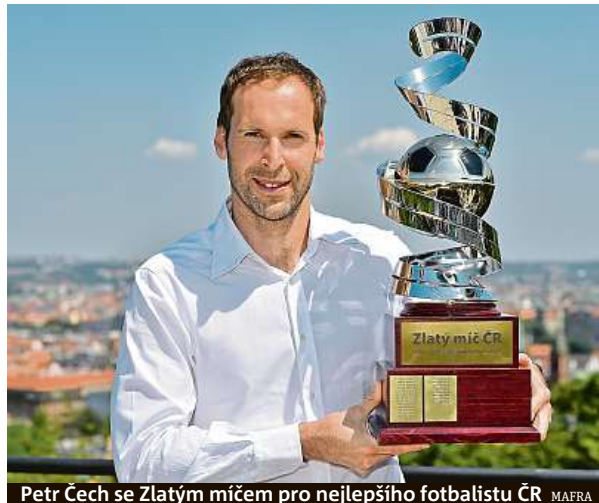
Petr Čech se Zlatým míčem pro nejlepšího fotbalistu ČR

Během bohaté kariéry chytil Čech také za Chelsea, Rennes nebo Spartu. Rekordman v počtu startů za český národní tým (124) do Arsenalu přišel v roce 2015 z Chelsea, kde strávil jedenáct let. Aktuální sezonu začal jako jednička Kanonýrů, ale po zranění musel přepustit místo v brance Němci Berndu Lenovi. V tomto ročníku tak plzeňský rodák odchytal za Arsenal jen