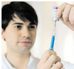
Chřipková vakcína MAFRA

Chřipka má ale průběh trochu jiný – nastupuje velmi rychle, často během jednoho dne. Objevuje se vysoká horečka, bolest hlavy, svalů a kloubů, silná únava, malátnost a nechutenství. Léčbu není vhodné ošidit, je zapotřebí dostatek odpočinku. Antibiotika v případě virových onemocnění nepomáhají, lze užít