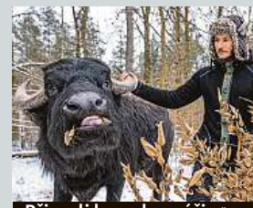
Přivezli ho ochranáři.

povede nová cyklostezka, která propojí českou a německou stranu. Plánovaná přestavba bývalé sladovny na minipivovar bude ale kvůli vysokým nákladům přesunuta na neurčito. Město v roce 2023 objekt pouze zakonzervuje, aby dál nechátral. Několik milionů korun má jít z dotací i kasy města.