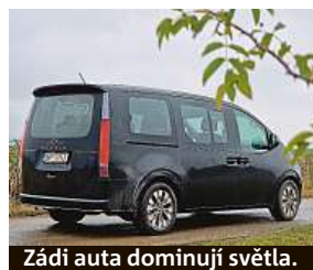
Zádi auta dominují světla.

Posádka, kterou vezete, je doslova nadšená. Obrovskými okny je všechno kolem vidět, kožené a extra pohodlné sedačky v prostřední řadě jdou elektricky rozložit do polohy vleže, jsou vyhříváné, a dokonce odvětrávané. Ambientní světla navozují fajn atmosféru, další lidi navíc usadíte na lavici vzadu a k tomu vám stále zůstává velký kufr. Ono to taky není nějaké malé auto, na délku měří pět a čtvrt metru, na šířku má rovné dva metry a na výšku bez deseti milimet-