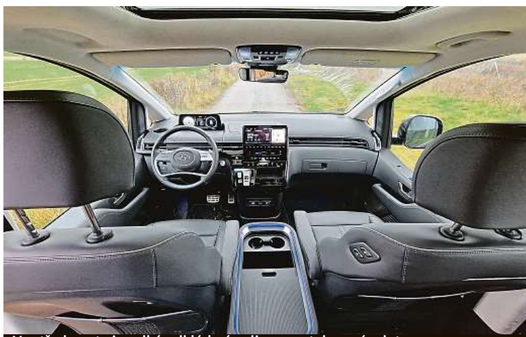
Ve středu auta je velká odkládací police se zatahovací roletou.