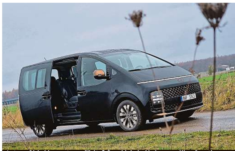
Je to pořádný kus auta, co říkáte? Černý lak dodává punc výjimečnosti.

Motor je úplně v pohodě, má dobré vychování, kultivované – zabírá, kdy má, a je tichý, navíc šetrný. Naše verze s automatem a pohonem všech kol chce průměrně 8,5 litru na sto. Osobní devítimístná verze tedy začíná pod milionem, čtyřkolka, automat a luxusní prvky stojí další desítky tisíc. PETR HOLEČEK