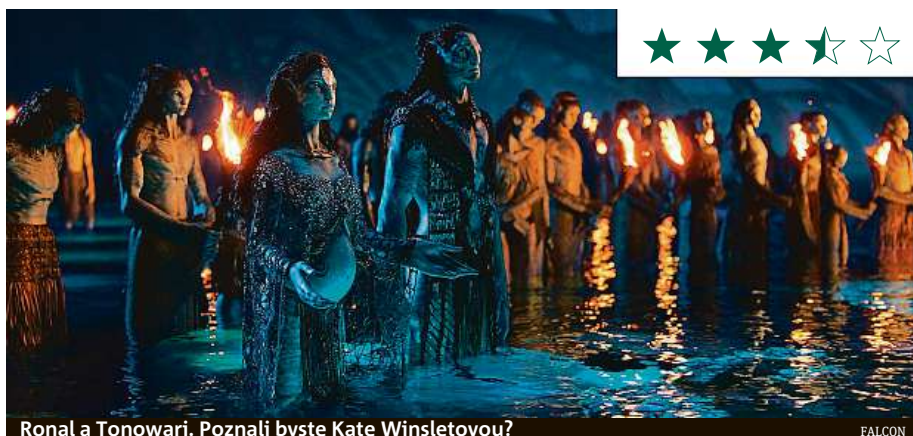
Ronal a Tonowari. Poznali byste Kate Winsletovou?

Děj se opět točí kolem modrých obyvatel planety Pandora, tentokrát se zaměřuje na dospívající generaci. Zápletka tříhodinového filmu by se dala shrnout jako trable šestičlenné rodiny. Hlavní postavy Jack Sully (hraje Sam Worthington) a Neytiri (Zoe Saldanová), které už známe, založili rodinu a musí se vypořádat