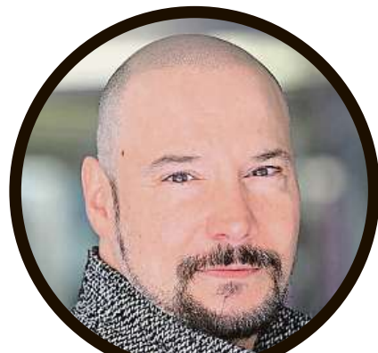
zpěvák Bohuš Matuš mikropigmentace