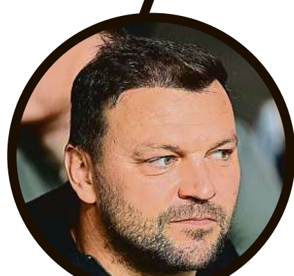
fotbalista Tomáš Ujfaluši transplantace vlasů