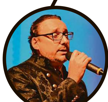
zpěvák Marian Vojtko opakovaná transplantace vlasů