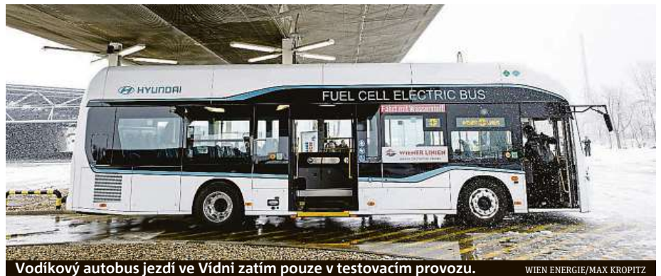
Vodíkový autobus jezdí ve Vídni zatím pouze v testovacím provozu.

Vodíkový pohon chce do budoucna využívat i pražský dopravní podnik. Kromě Brna a Litvínova totiž v současnosti vzniká vodíková čerpací stanice i v hlavním městě, konkrétně na Barrandově. Hotovo má být příští rok. Právě tahle vodíková čerpačka bude následně sloužit i proto-