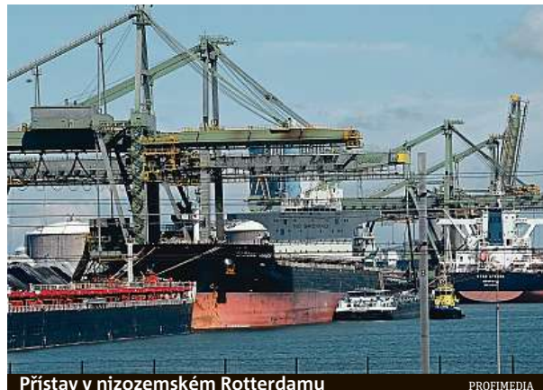
Přístav v nizozemském Rotterdamu

Úkolem sběračů je dostat drogy z kontejneru a pak pryč z doků, aby je bylo možné dopravit do Amsterdamu, Berlína, Londýna nebo Prahy. „Přístav je zlatý důl, je to paráda,“ řekl muž s rozostřeným obličejem a kapucí na hlavě novináři Dannymu Ghosenovi v jeho pořadu Danny's Wereld, který se vysílá na stanici společnosti VPRO. „Můžu dobře vydělávat, je to blízko domova a práce je vždycky,“ pochvaluje si. Je jedním z mladých mužů, kte-