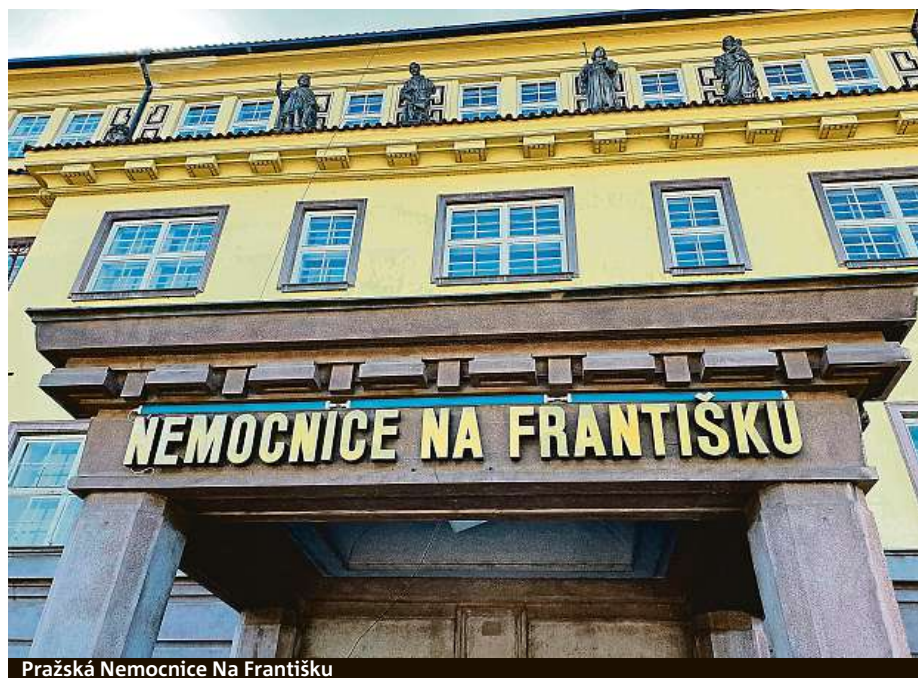
Pražská Nemocnice Na Františku