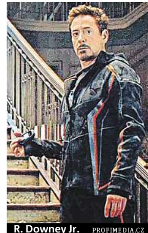
R. Downey Jr.

zpravodajské sítě a stanice Fox Broadcasting, Fox News Channel a další, které nebudou součástí dohody. Disney převezme také dluh společnosti 13,7 miliardy dolarů. Podle Financial Times bude mít spojení dalekosáhlé důsledky pro globální mediální