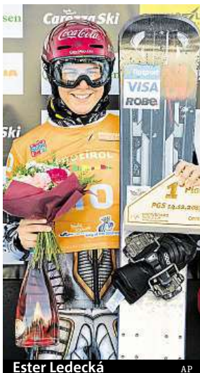
Ester Ledecká

Na snowboardu trénovala česká reprezentantka jen tři dny, ale i to jí stačilo, aby byla včera nejrychlejší. „Rozhodně je to skvělé a lepší než začít poslední. To je jasné,“ usmála se po závodě Ledecká a dodala: „Bylo to těžké, dost