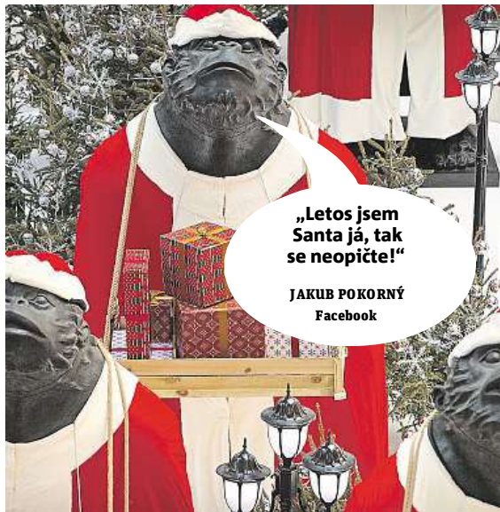
JAKUB POKORNÝ Facebook

Napište bublinu a reagujte na sloupek na: www.facebook.com/denikmetro