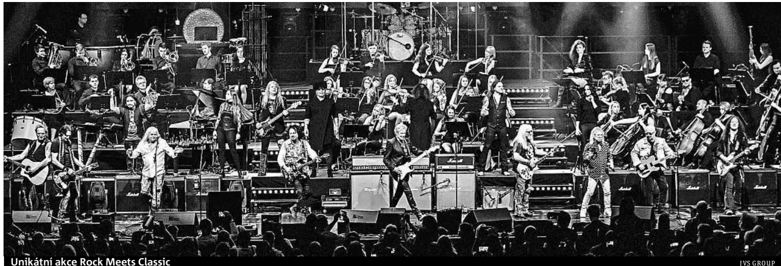
Unikátní akce Rock Meets Classic