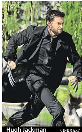
Hugh Jackman

Pokud bude dohoda schválena, Disney upevní svou pozici největší mediální společnosti na světě. Podle dohody 21st Century Fox před akvizicí oddělí do samostatné firmy