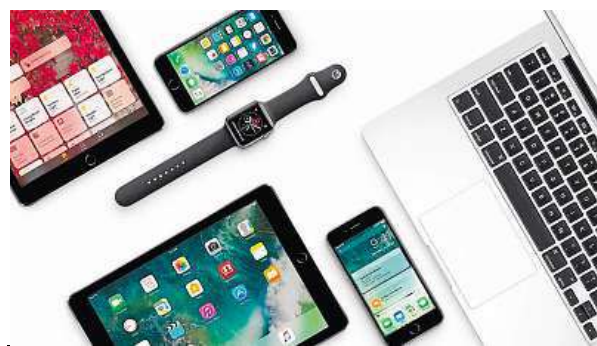
Výrobky Apple si můžete vybírat do sytosti.

V minulosti to potvrdil třeba přednostním prodejem iPhoneů nebo když jako jediný dokázal naskladnit hodinky Apple Watch včetně jejich