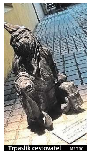
Trpaslík cestovatel METRO

Jestliže chcete navštívit Táta Trpaslíka, Vězeníka, Hodníka nebo některého jiného skřítku, může vám při jejich hledání pomoci trpasličí mapa. Koupíte ji v některém z informačních center ve městě, k jejich hledání ale také poslouží mobilní aplikace. HOPO