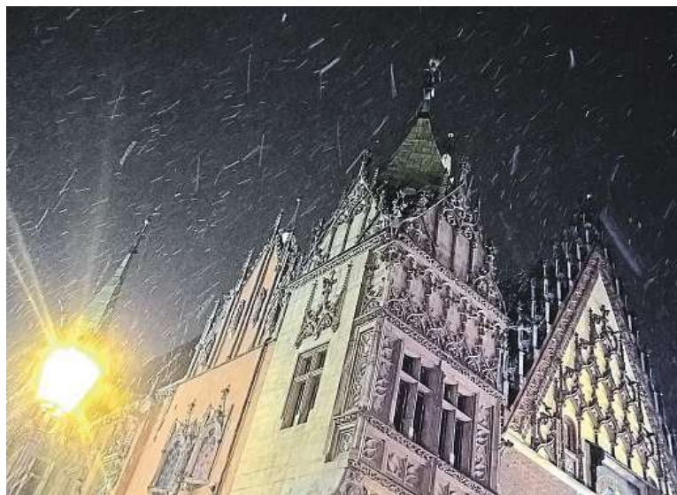
Radnice na Rynku byla postavena už ve třináctém století.