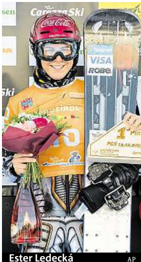
Ester Ledecká

Na snowboardu trénovala česká reprezentantka jen tři dny, ale i to jí stačilo, aby byla včera nejrychlejší. „Rozhodně je to skvělé a lepší než začít poslední. To je jasné,“ usmála se po závodě Ledecká a dodala: „Bylo to těžké, dost