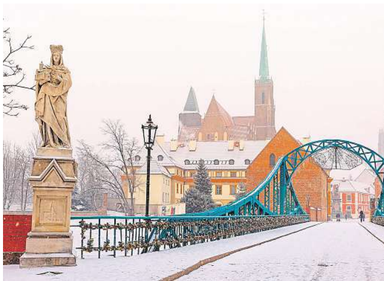
Kostel sv. Kříže a sv. Bartoloměje jsou dva kostely v jednom.