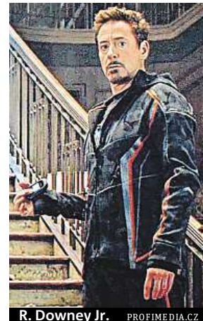
R. Downey Jr.

zpravodajské sítě a stanice Fox Broadcasting, Fox News Channel a další, které nebudou součástí dohody. Disney převezme také dluh společnosti 13,7 miliardy dolarů. Podle Financial Times bude mít spojení dalekosáhlé důsledky pro globální mediální