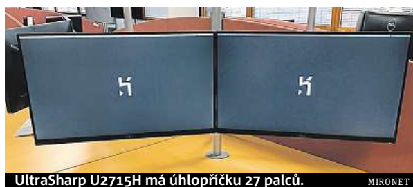
UltraSharp U2715H má úhlopříčku 27 palců.

Monitor zaujme úctyhodnou úhlopříčkou 27 palců a vysokým WQHD rozlišením (2560 x 1440 px). Obraz je díky němu neuvěřitelně ostrý a mnohem jemnější než třeba u dnes již standardního Full HD. Dalším trumfem je použitá IPS technologie, která nabízí přesnou reprodukci barev i široké pozorovací úhly. Pro optimální vizuální požitky je navíc monitor už z to-