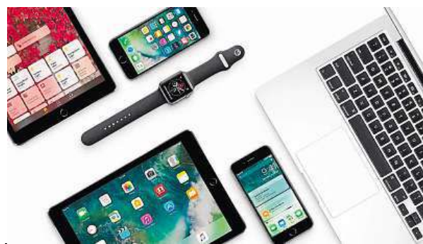
Výrobky Apple si můžete vybírat do sytosti.

V minulosti to potvrdil třeba přednostním prodejem iPhoneů nebo když jako jediný dokázal naskladnit hodinky Apple Watch včetně jejich