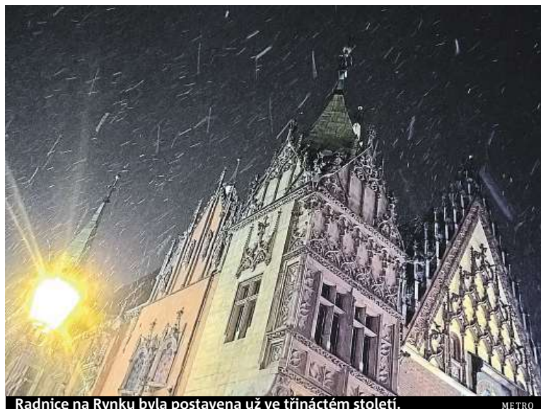
Radnice na Rynku byla postavena už ve třináctém století.