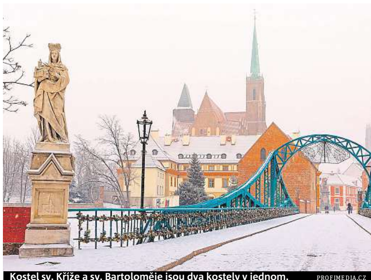
Kostel sv. Kříže a sv. Bartoloměje jsou dva kostely v jednom.