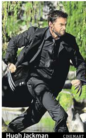
Hugh Jackman

Pokud bude dohoda schválena, Disney upevní svou pozici největší mediální společnosti na světě. Podle dohody 21st Century Fox před akvizicí oddělí do samostatné firmy