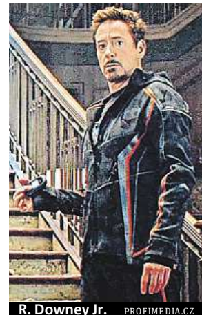
R. Downey Jr.

zpravodajské sítě a stanice Fox Broadcasting, Fox News Channel a další, které nebudou součástí dohody. Disney převezme také dluh společnosti 13,7 miliardy dolarů. Podle Financial Times bude mít spojení dalekosáhlé důsledky pro globální mediální