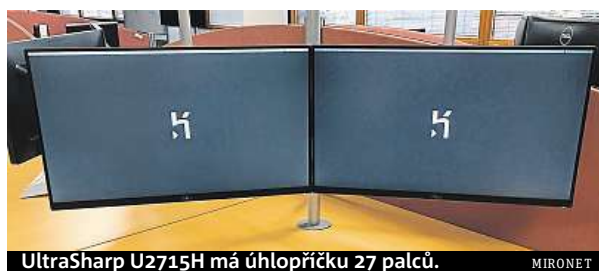
UltraSharp U2715H má úhlopříčku 27 palců.

Monitor zaujme úctyhodnou úhlopříčkou 27 palců a vysokým WQHD rozlišením (2560 x 1440 px). Obraz je díky němu neuvěřitelně ostrý a mnohem jemnější než třeba u dnes již standardního Full HD. Dalším trumfem je použitá IPS technologie, která nabízí přesnou reprodukci barev i široké pozorovací úhly. Pro optimální vizuální požitky je navíc monitor už z to-