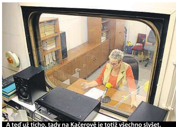
A teď už ticho, tady na Kačerově je totiž všechno slyšet.

ho rozhlasu. Mezi jednotlivými místnostmi jsou jen úzké panely, průzor do studia nápadně připomíná okno ze staré soupravy metra. Jde se na věc. Ticho. „Nemocnice Motol, Petřiny, Bořislavka, Dejvická, Hradčanská...“ spouští Lavičková a spolu s novými názvy stanic odřikává i všechny ostatní, které již Pražané dávno znají.