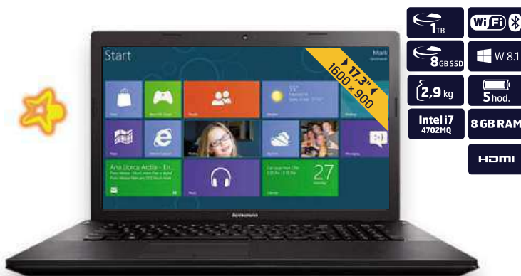
NOTEBOOK LENOVO IDEAPAD G710

obj. SMS kód 348602, 348601 21499 Kč nebo měsíčně minimálně* 1500 Kč