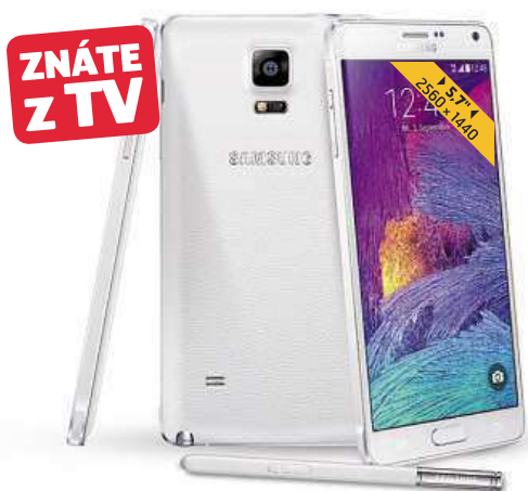
SMARTPHONE SAMSUNG N910 GALAXY NOTE 4 WHITE/BLACK

Potěšte své blízké třeba novým smartphonem nebo notebookem.