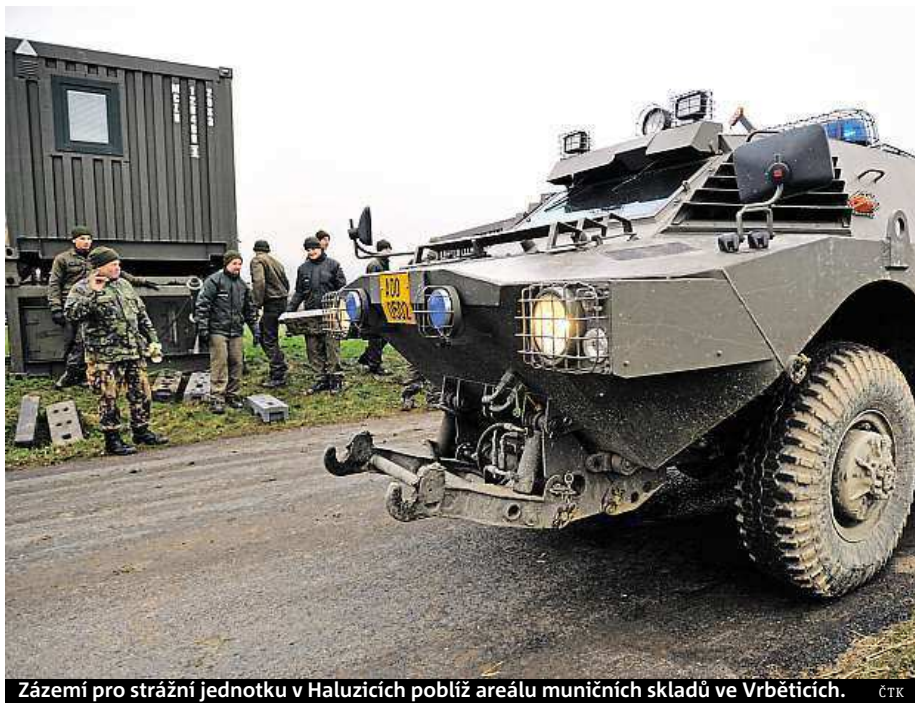
Zázemí pro strážní jednotku v Haluzicích poblíž areálu muničních skladů ve Vrbětících.

Ač Daněk sám žije v obci vzdálené od Vrbětice a dalších obcí postižených bouchaj-