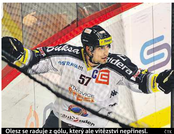
Olesz se raduje z gólu, který ale vítězství nepřinesl. ČTK

Přestože Vítkovičtí byli v závěru výrazně lepší, do rivala bušili bez efektu. Třicet sekund před koncem hosté zkusili i power play, ale Hrubec už neohrozil. ČTK