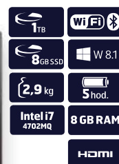
NOTEBOOK LENOVO IDEAPAD G710

obj. SMS kód 343253 19999 Kč nebo měsíčně minimálně* 1000 Kč