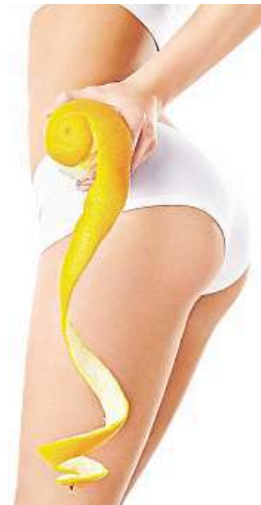
Celulitida trápí dost žen. AA

Pomerančová kůže je známkou nahromadění škodlivin v těle, dochází k porušení kolagenních vláken, a to je příčina ztráty pružnosti a kvality kůže. Mezi nejběžnější příčiny vzniku celulitidy kromě genetických dispozic patří hormony – přirozeně vytvá-