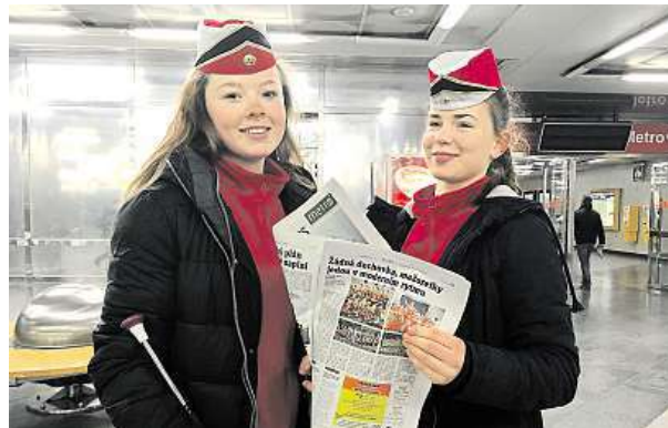
Pražské mažoretky TJ Sokol Vysočany se oblékly stylově.

Dva sportovní týmy si včera ráno musely přivstat, aby mohly rozdávat deník Metro.