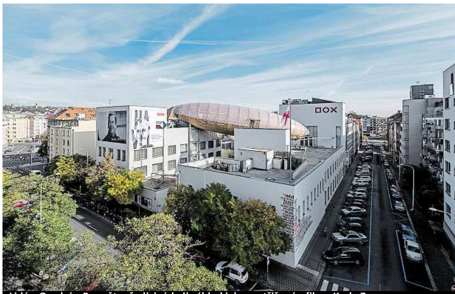
Lidé v Osadní a Poupětově ulici získali výhled jako vystřižený z filmu Karla Zemana. JAN SLAVÍK

Stavba, svým tvarem trochu připomínající třeba torpédo, doutník, ale především legendární vzducholoď Hindenburg, které se může podle Války svou velikostí plnohodnotně rovnat, odkazuje k touze cestovat do neznámých krajín a světů. Proto si před dvě-