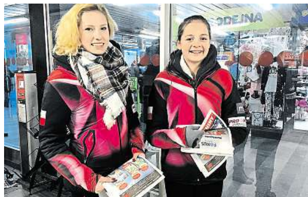
Klub SympA, jeho kadetky mají titul mistra světa. 2x METRO