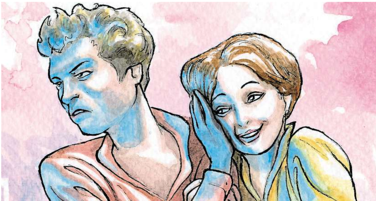
A Midsummer Night's Dream

HANNAH BERRY (HTTP://HANNAHBERRY.CO.UK/)