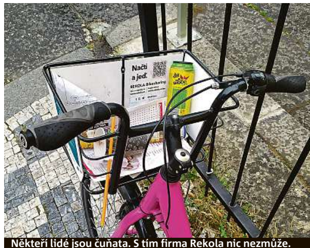
Někteří lidé jsou čunata. S tím firma Rekola nic nezmůže.