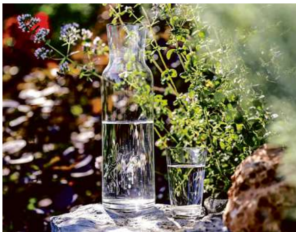
Podpořit projekty můžete nákupem v nadačním e-shopu ( eshop.nfveolia.cz )

Třeba s tím, že na něj dáte miskou s vodou, kterou ptáci a hmyz ve městě těžce hledají. Je to hloupost, která má uprostřed města obrovský efekt.