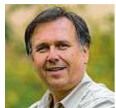
Petr Hamerník Zoo Praha