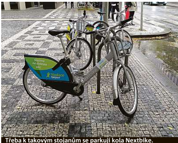
Třeba k takovým stojanům se parkují kola Nextbike.

Bordel je v popelnici. Jedu. Přehazovačka funguje, světlo svítí, blatníky kolo má. S bicyklem jsme hned kamarádi. Jen ten dešť kazí projížďku. Z Anděla jsem u smíchovského nádraží hned. Test kolo se mi hodí. Jsem tu objednaný na kontrolu u lékaře. Podle mapy hledám, kde