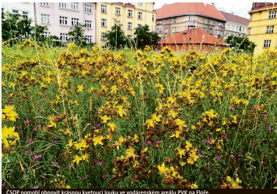
ČSOP pomohl obnovit krásnou kvetoucí louku ve vodárenském areálu PVK na Floře.

Máte také řadu firemních partnerů. Spolupracujete například s Pražskými vodovody a kanalizacemi a skupinou Veolia. Jak to celé začalo?