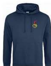
Unisex mikina Dan Bárta 950 Kč