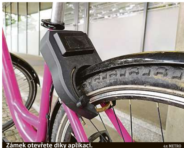
Zámek otevřete díky aplikaci.