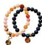
Náramek Bára Poláková 350 Kč