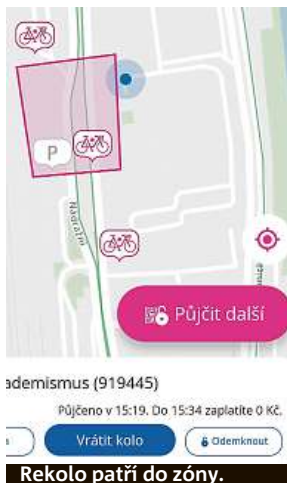
Rekola patří do zóny.