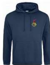
Unisex mikina Dan Bárta 950 Kč