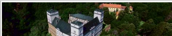
Zastavovaný areál zámku Račice v rámci dluhopisového programu e-Finance CZ v celkové hodnotě uveřejněné na adrese www.e-finance.eu/zajistene-dluhopisy .

Koncern e-Finance, a.s. v současnosti spravuje investice do nemovitostí v hodnotě přesahující 1 miliardu korun. Investiční strategií e-Finance je investovat prostředky získané z dluhopisů do nákupu a výstavby rezidenčních a komerčních nemovitostí v atraktivních lokalitách České republiky. Portfolio investic najdete na www.e-finance.eu .