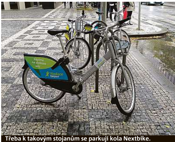
Třeba k takovým stojanům se parkují kola Nextbike.

Bordel je v popelnici. Jedu. Přehazovačka funguje, světlo svítí, blatníky kolo má. S bicyklem jsme hned kamarádi. Rozpršelo se. Co když mokré dlaždičky v Nádražní kloužou... Cestou z práce testuji Nextbike. Stejný scénář. Opět je to rychlovka. Instalace aplikace, spárování s Lítačkou, tes-