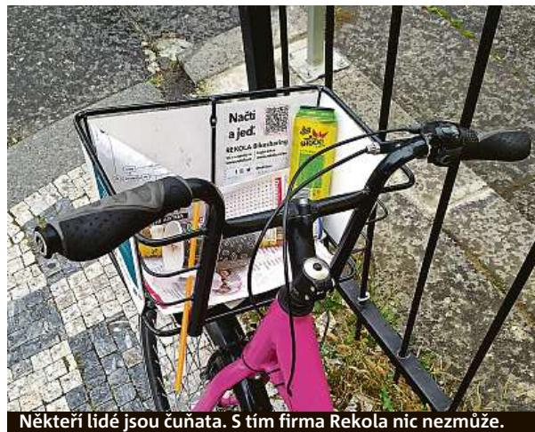
Někteří lidé jsou čunata. S tím firma Rekola nic nezmůže.

kolo odstavím. Jde to jen na vyznačených místech. Pokud kolo nechám mimo parkovací zónu, platil bych „pokutu“ 320 korun. V centru, v Holešovicích, v Karlíně nebo třeba v Bubenci jsou zóny rozsáhlé. Oproti tomu například v Braníku jsou jen tři menší parkovací ostrůvky. V Krči Rekolo nemůžete nechat vůbec.