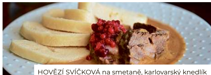
HOVĚZÍ SVÍČKOVÁ na smetaně, karlovarský knedlík

EFI SPA HOTEL**** nám. 28 října 23, Brno, +420 515 557 500, recepce@efispahotel.cz , www.efispahotel.cz