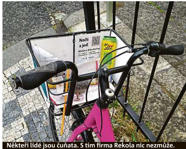
Někteří lidé jsou čunata. S tím firma Rekola nic nezmůže.

kolo odstavím. Jde to jen na vyznačených místech. Pokud kolo nechám mimo parkovací zónu, platil bych „pokutu“ 320 korun. V centru, v Holešovicích, v Karlíně nebo třeba v Bubenči jsou zóny rozsáhlé. Oproti tomu například v Braníku jsou jen tři menší parkovací ostrůvky. V Krči Rekolo nemůžete nechat vůbec.