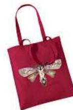
Taška Léna Brauner 300 Kč