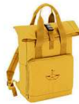
Batož Sestry Geislerovy 850 Kč

Kompletní nabídku naleznete na www.klokart.cz f klokart i klokart