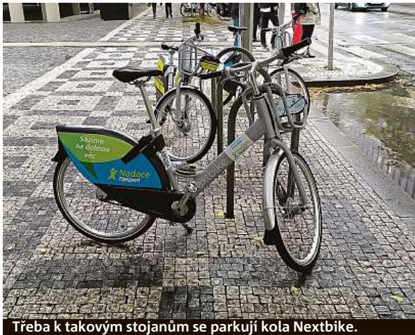
Třeba k takovým stojanům se parkují kola Nextbike.

Bordel je v popelnici. Jedu. Přehazovačka funguje, světlo svítí, blatníky kolo má. S bicyklem jsme hned kamarádi. Rozpršelo se. Co když mokré dlaždičky v Nádražní kloužou... Cestou z práce testuji Nextbike. Stejný scénář. Opět je to rychlovka. Instalace aplikace, spárování s Lítačkou, tes-