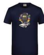
Tričko Návrat do budoucnosti 650 Kč