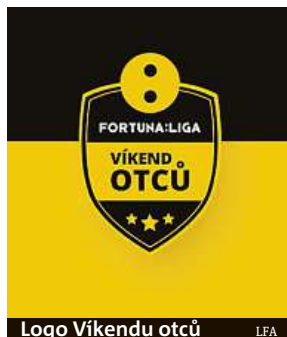
Logo Víkendu otců LFA

To vše doprovodí tradiční akce Ligové fotbalové asociace (LFA) Víkend otců. Ta má za cíl přivést k návštěvě utkání co nejvíce rodin s dětmi a současně upozornit na fenomén sportu a fotbalu, kdy právě rodiče a jejich péče stojí za kariérami a úspěchy všech vrcholných profesionálních hráčů. Víkend otců jako kampaň se ponese všemi duely jedenáctého kola dvou nejvyšších tuzemských soutěží.