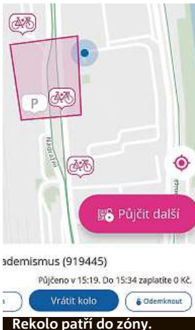
Rekola patří do zóny.