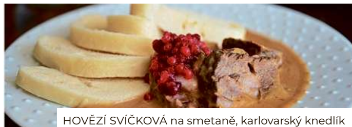
HOVĚZÍ SVÍČKOVÁ na smetaně, karlovarský knedlík

EFI SPA HOTEL**** nám. 28 října 23, Brno, +420 515 557 500, recepce@efispahotel.cz , www.efispahotel.cz