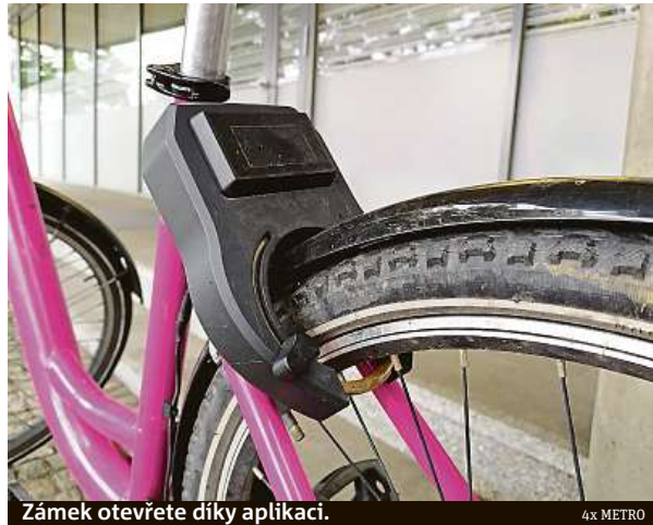
Zámek otevřete díky aplikaci.