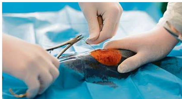
Některé úkony studenti jen vidí, nevyzkouší si je.

Chtěl bych, aby bylo jen tolik studentů, pro kolik jsou na školách prostory a vyučujících, aby případně bylo víc míst. Aby byl poměr vyučujících ke studentům nižší než v současnosti. Teď na jednoho pedagoga připadá patnáct až dvacet lidí. Reálný ideál by byl jedna ku pěti. Tady vyrůstají budoucí lékaři, kteří to budou mít naučené z knih, ne z praxe. PAVEL HRABICA