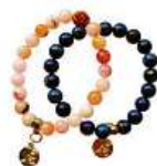
Náramek Bára Poláková 350 Kč