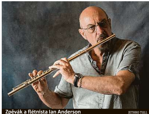
Zpěvák a flétnista Ian Anderson

Koncerty, které se chystáte mít v Česku, byly přelo-