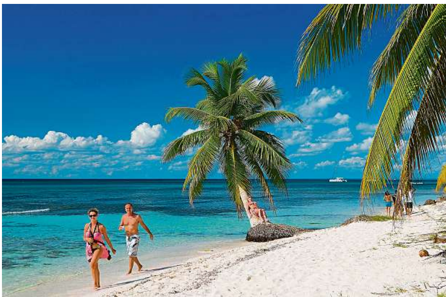
Lidé také létají do exotických zemí, třeba do Dominikánské republiky.