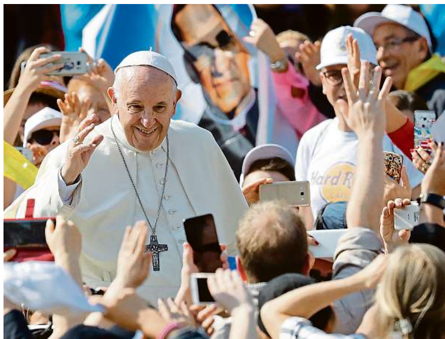
Hlava katolické církve svatořečila Pavla VI. Papež František včera na vatikánském Svatopetrském náměstí prohlásil svatými sedm lidí včetně dvou výrazných osobností. Papeže Pavla VI., který v roce 1968 odsoudil vstup vojsk Varšavské smlouvy do Československa, a salvadorského arcibiskupa Óscara Rome- ra. Ten byl zavražděn v roce 1980 během občanské války ve středoamerické zemi.