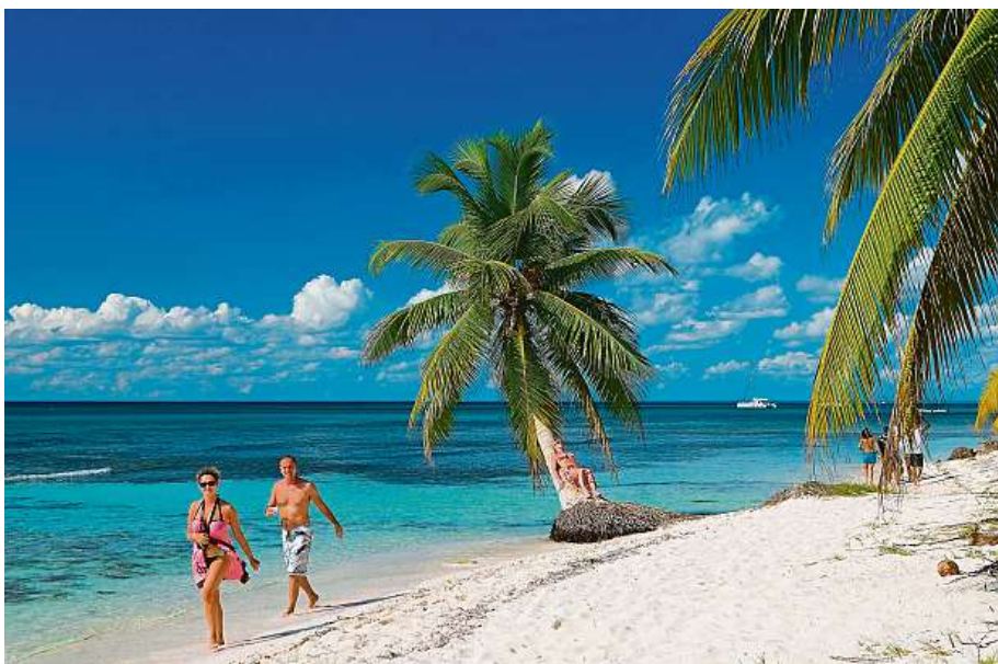
Lidé také létají do exotických zemí, třeba do Dominikánské republiky.