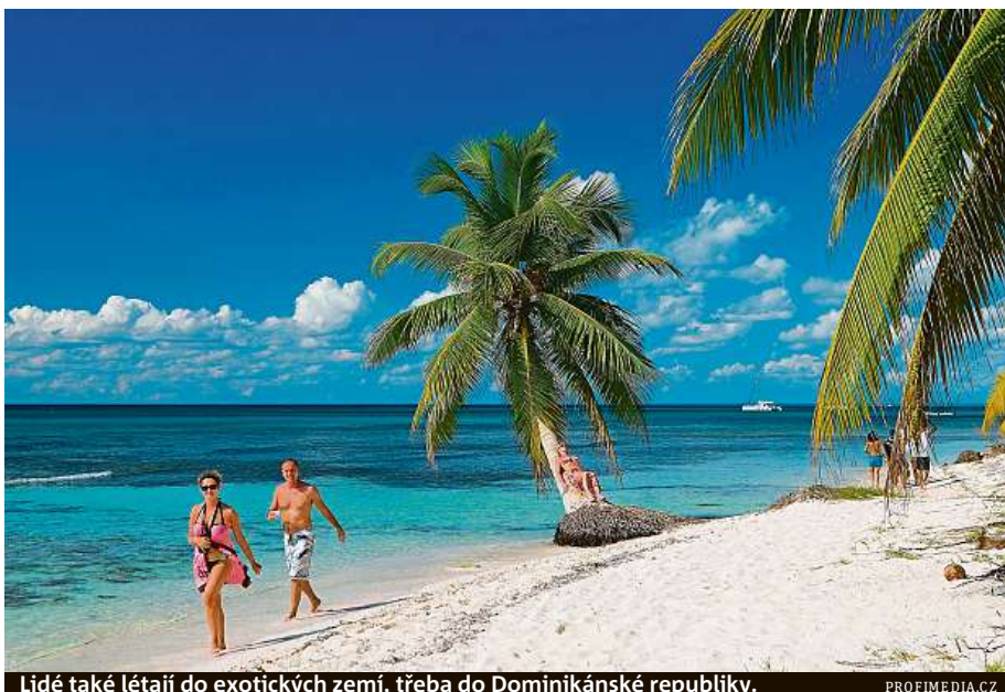
Lidé také létají do exotických zemí, třeba do Dominikánské republiky.