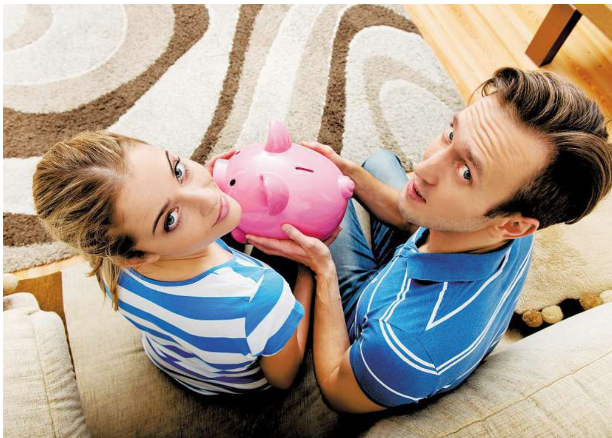
Rodinný rozpočet je zapeklitá věc. Když dojde k výpadku příjmů, měli byste mít vytvořenou finanční rezervu.