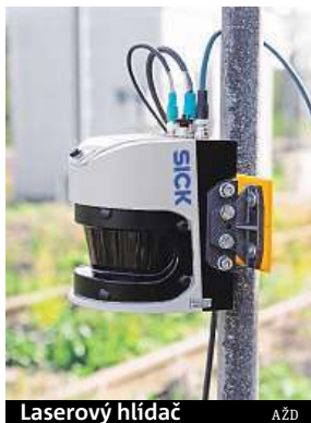
Laserní hlídač AZD

Případů neubývá. Naposled v úterý na Hodonínsku se na přejezdu srazil vlak s traktorem. Řidič traktoru střet nepřežil. Úterní nehoda je v tomto roce už třiatřicátá, při níž na přejezdu zemřel člověk. Stát se proto snaží vymyslet, jak udělat železniční přejezdy bezpečnější, a tak testuje hned tři podobné technologie. „Zařízení sleduje přesně vymezenou plochu.