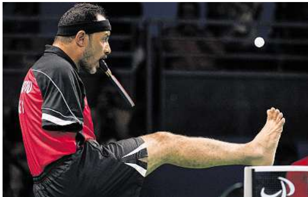
Bojovník, o kterém mluví sportovní svět

Na paralympiádě v Riu bojuje stolní tenista, který drží pátku v puse.