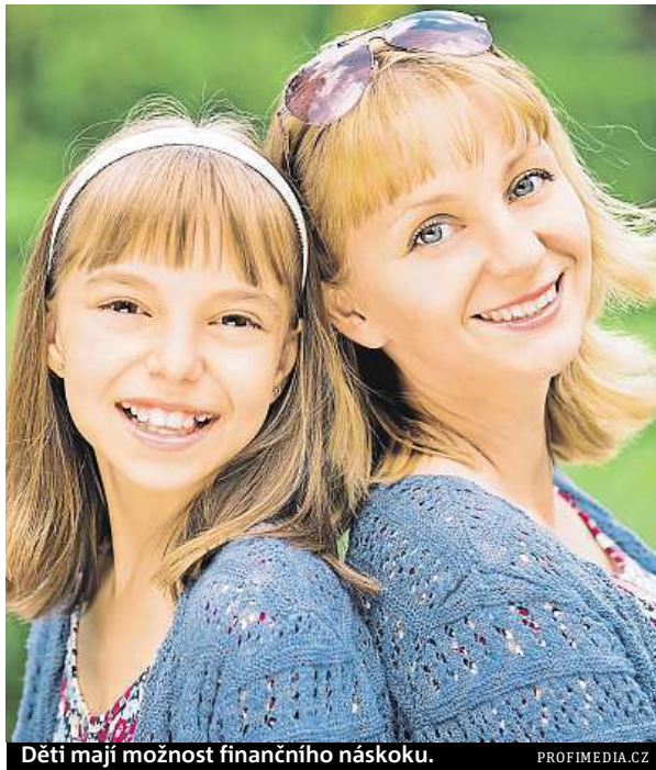
Děti mají možnost finančního náskoku.

Spořitelny garantují neprodělek, protože po dobu šesti let nesmějí měnit úrokovou sazbu. „Po započítání všech poplatků a podpory výnos ak-