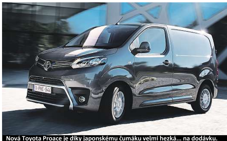
Nová Toyota Proace je díky japonskému čumáku velmi hezká... na dodávku.