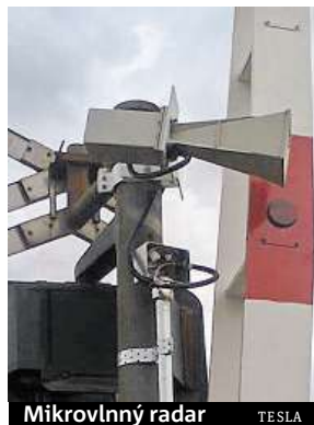
Mikrovlnný radar TESLA