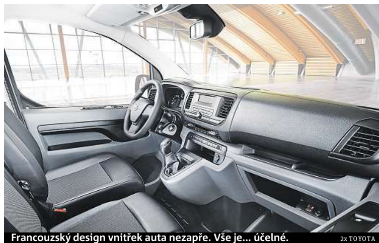
Francouzský design vnitřek auta nezapře. Vše je... účelné.