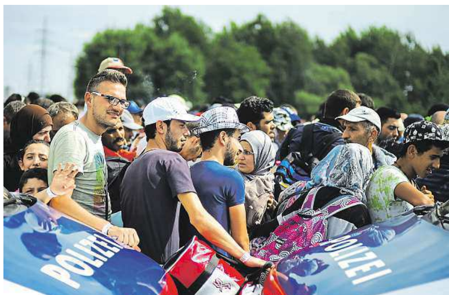
Policie svými auty blokuje migranty na hranicích mezi Maďarskem a Rakouskem.