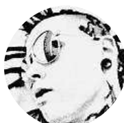
Wewe Adidog Kepková Mhd Praha – naplánování co nejrychlejší trasy.