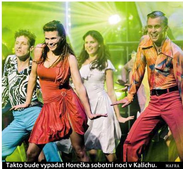
Takto bude vypadat Horečka sobotní noci v Kalichu.

Do konce roku se milovníci muzikálů dočkají ještě čtyř premiér. Iago Janka Ledeckého však mezi nimi není.