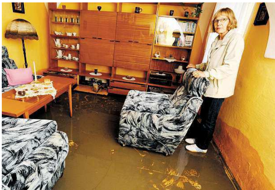
Takto to vypadalo v jednom ze zaplavených domů v Dolních Věstonicích na Břeclavsku. ČTK

Mezi Pavlovem a Dolními Věstonicemi na Břeclavsku se včera dopoledne kvůli deštům sesunul svah na kemp. Půda kompletně zasypala jeden z desítek karavanů v rybářské oblasti. Hasiči kemp evakuovali. Při sesuvu se zranila jedna žena, kterou záchranáři odvezli do nemocnice. Obytnou oblast událost nijak nezasáhla, policisté však museli uzavřít poškozenou silnici nad svahem. Hrozí sesuv komunikace, a proto tam nesmí jezdit auta. Podle meteorologů vysoký stupeň nebezpečí přetrvává až do dnešního poledne. ČTK