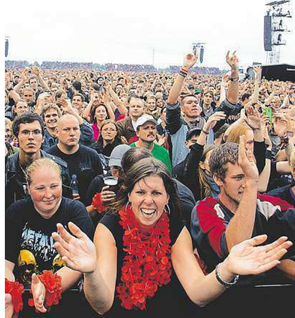
Na pražský Vypich dorazilo na 75 tisíc lidí.