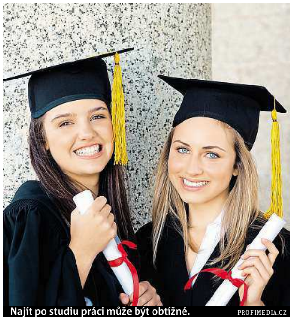
Najít po studiu práci může být obtížné.

Další věcí, která v dnešní době studenty hodně zajímá, je možnost praktické výuky a stáží v zahraničí. Nabídka státních a vysokých škol se v tomto směru liší. Například v projektu Erasmus jsou v poskytování finančních příspěvků lehce zvýhodňováni studenti veřejných vysokých škol. ROMANA BARBOŘIKOVÁ