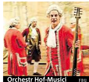
Orchestr Hof-Musici FBU

Organizátoři Festivalu barokních umění v Českém Krumlově chtějí divákům nabídnout představení ve stejných podmínkách, jako tomu bylo v 18. století. V Zámeckém barokním divadle v pátek totiž zazní novodobá premiéra barokní opery L'Ipermestra, a to v plně scénickém zpracování za využití původních barokních kulís. Zpěváci i orchestr budou v dobových kostýmech, osvětlení bude identické podmínkám tehdejší doby, diváci budou sedět na stejných jednoduchých lavicích. Opera bude uvedena cel-