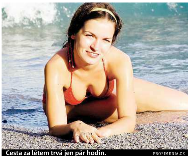
Cesta za létem trvá jen pár hodin.

Češi se mohou vypravit do Egypta, kam se po třech letech, kdy zemi sužovaly nepokoje, opět vrací turisté. Je tam zase bezpečno. Stabilita v zemi se zlepšila a mnoho evropských zemí už zrušilo procesty sem svá negativní doporučení. Vrací se také standard, na který byli turisté