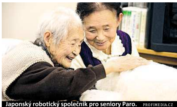
Japonský robotický společník pro seniory Paro.

Jedním z důvodů, proč se Japonci dožívají tak vysokého věku, je podle odborníků místní zdravá kuchyně. Velkou roli hrají také pokroky v geriatrické medicíně, která se zabývá problematikou zdravotního a funkčního stavu ve stáří. Seniorům se ve 126miliónovém Japonsku věnuje i technický průmysl, který pro ně vyrábí robotické společníky (viz foto). METRO