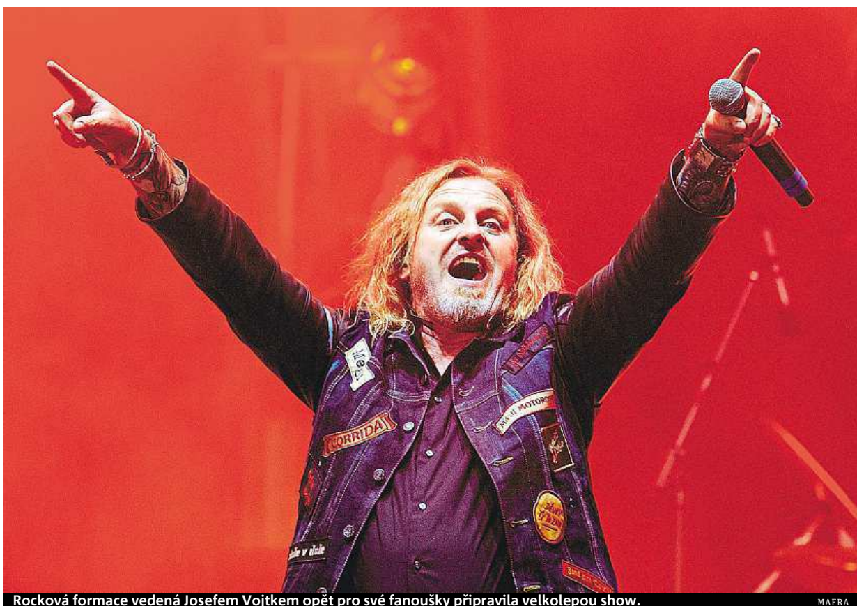
Rocková formace vedená Josefem Vojtkem opět pro své fanoušky připravila velkolepou show.

Show zahájil Kabát průřezem své tvorby od legendární skladby Porcelánový prasata po písně z novějších alb. Publikum nadchli třeba skladbami Šaman, Bára nebo Go sata-ne go, nemohla ale chybět ani tradičně jedna z nejúspěšnějších písní této formace Žízeň, při které zpěvem kapelu podpořilo celé publikum.