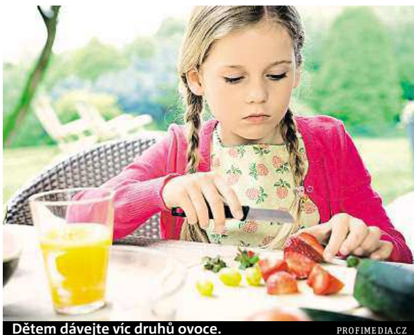
Dětem dávejte víc druhů ovoce.

Pro děti, stejně jako pro dospělé, je důležitá pestrá strava. „Díky ovoci a zelenině navíc získají i velké množství vi-