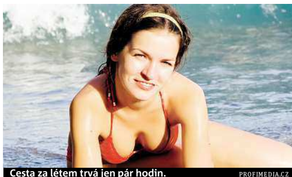
Cesta za létem trvá jen pár hodin.