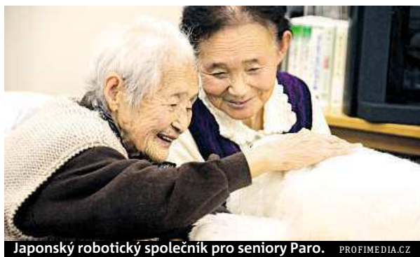
Japonský robotický společník pro seniory Paro.

Jedním z důvodů, proč se Japonci dožívají tak vysokého věku, je podle odborníků místní zdravá kuchyně. Velkou roli hrají také pokroky v geriatrické medicíně, která se zabývá problematikou zdravotního a funkčního stavu ve stáří. Seniorům se ve 126miliónovém Japonsku věnuje i technický průmysl, který pro ně vyrábí robotické společníky (viz foto). METRO