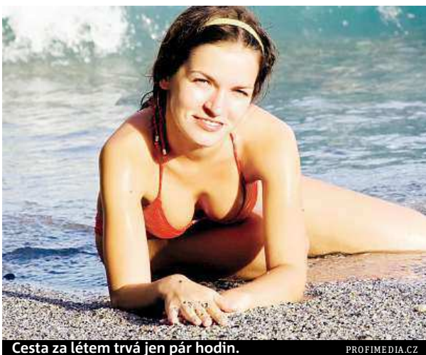
Cesta za létem trvá jen pár hodin.

Češi se mohou vypravit do Egypta, kam se po třech letech, kdy zemi sužovaly nepokoje, opět vrací turisté. Je tam zase bezpečno. Stabilita v zemi se zlepšila a mnoho evropských zemí už zrušilo procesty sem svá negativní doporučení. Vrací se také standard, na který byli turisté