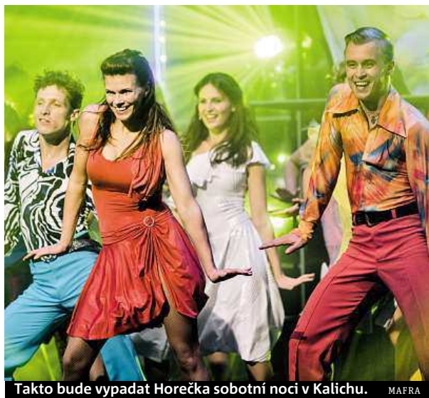
Takto bude vypadat Horečka sobotní noci v Kalichu.

Do konce roku se milovníci muzikálů dočkají ještě čtyř premiér. Iago Janka Ledeckého však mezi nimi není.