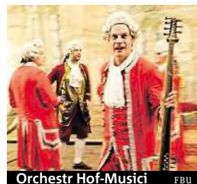
Orchestr Hof-Musici FBU

Organizátoři Festivalu barokních umění v Českém Krumlově chtějí divákům nabídnout představení ve stejných podmínkách, jako tomu bylo v 18. století. V Zámeckém barokním divadle v pátek totiž zazní novodobá premiéra barokní opery L'Ipermestra, a to v plně scénickém zpracování za využití původních barokních kulís. Zpěváci i orchestr budou v dobových kostýmech, osvětlení bude identické podmínkám tehdejší doby, diváci budou sedět na stejných jednoduchých lavicích. Opera bude uvedena cel-