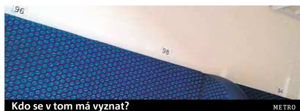
Kdo se v tom má vyznat?